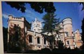
Dom Generalny w Jabłonowie

Założone przez bl. Marię Karłowską 8 grudnia 1894 r. w Poznaniu, w celu opieki nad dziewczętami i kobietami moralnie upadłymi. Celem Zgromadzenia jest naśladować Chrystusa Dobrego Pasterza w myśl hasła: „Szukać i zbawić to, co zginęło” (Łk 19,10). Zgromadzenie jest obecne w 3 krajach. Siostry prowadzą placówki opiekuńczo-wychowawcze dla dziewcząt zagrożonych niedostosowaniem społecznym, zapewniając im ukończenie gimnazjum. W trosce o ratowanie zagrożonego dziś życia dzieci nienarodzonych udzielają pomocy samotnym matkom. Posługują jako pielęgniarki i opiekunki chorych. Włączają się w duszpasterstwo Kościoła jako katechetki, zakrystianki i organistki, prowadzą przedszkole i świetlicę dla dzieci, wypiekają komunikanty i oplatki wigilijne oraz wykonują haft liturgiczny. W Diecezji Toruńskiej Siostry Pasterki mają swój Dom Generalny w Jabłonowie, gdzie znajduje się Diecezjalne Sanktuarium Bl. Marii Karłowskiej oraz Nowicjat Zgromadzenia. Prowadzą Placówkę Opiekuńczo – Wychowawczą dla Dziewcząt w Pniewitem. Pracują w Toruńskim Centrum Caritas oraz w Wyższym Seminarium Duchownym w Toruniu.