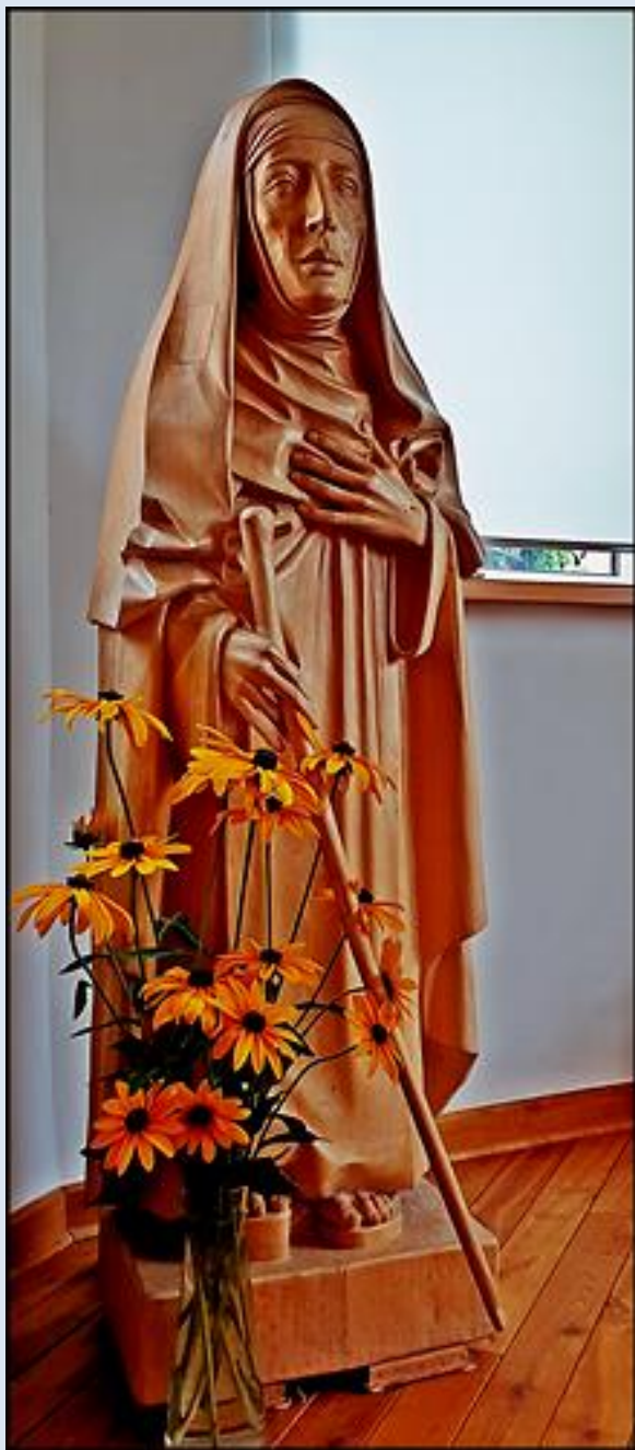
Majdan (MZW) – zdj. tsw