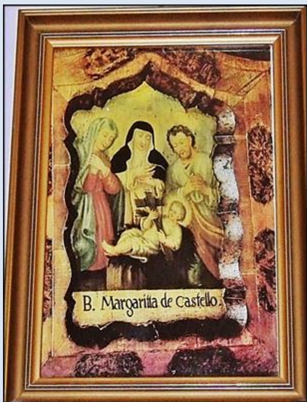
Majdan, dom RODZINY MATKI BOŻEJ BOLESNEJ (zdj. tsw) Majdan, dom RODZINY MATKI BOŻEJ BOLESNEJ (zdj. tsw)