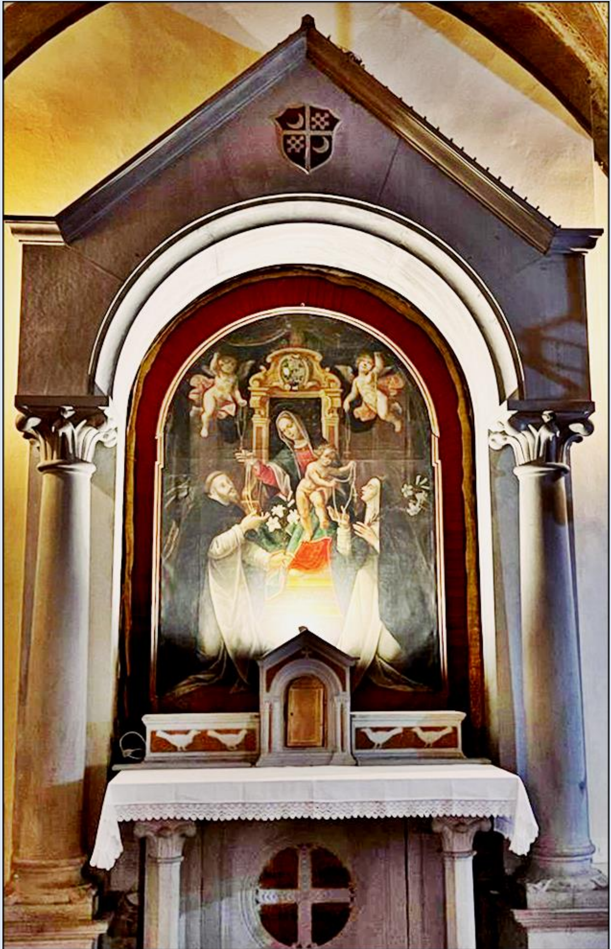
Włochy, Città di Castello - Kościół pw. św. Dominika (Chiesa di San Domenico)