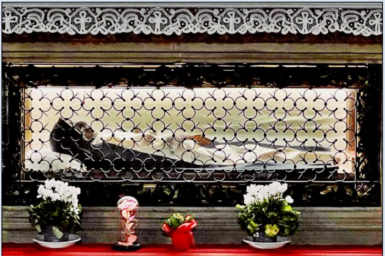
Włochy, Città di Castello - Kościół pw. św. Dominika (Chiesa di San Domenico) – zdj. KJ