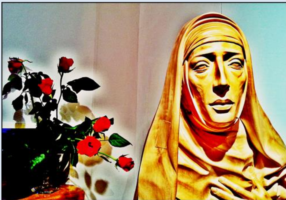
Majdan, dom RODZINY MATKI BOŻEJ BOLESNEJ (zdj. tsw)