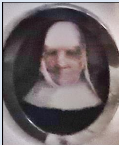
Oświęcim, Przedsiónek Ko. MB Bolesnej

Proszę was w imię Pańskie i w imię św. O. Franciszka Abyście zachowały cnotę ubóstwa do końca życia waszego Niech was Bóg błogosławi Słowa testamentu Matki Założycielki.