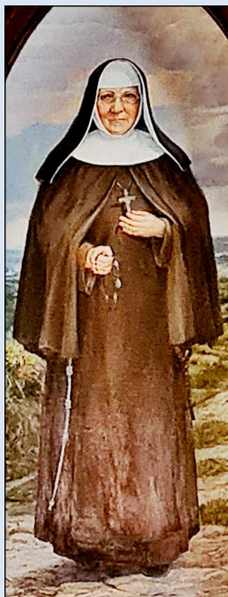
Oświęcim, Ko. MB Bolesnej – ołtarz i miejsce grobowe Błogosławionej