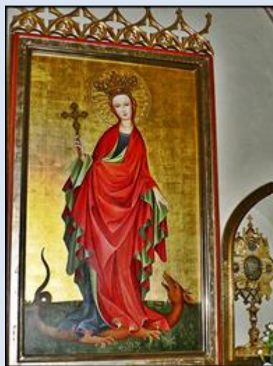
9. USA – Waszyngton, Moz. w baz. Niepokal. Poczęcia NMP; P1270311- 30.IX.'08 M3,10- Nowy Sącz, MAŁ, ob. w baz. św. Małgorzaty Antioch.