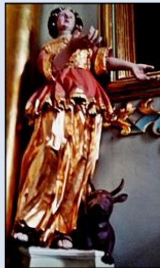
Ruda Śląska-Nowy Bytom, ko. św. Pawła (zdz. tsw) Warta, ko. WNMP (zdz. Andrzej Świniarski)