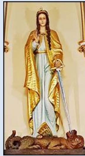
M3,17- Skała, MAŁ, wt w ko św. Mikołaja M3,18- Pelplin, fg z XIV w. w Muzeum Diecez. Bytom, ko. św. Małgorzaty (zdz. pw)