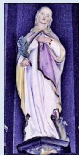
M3,14- Witów, ŁDZ, ob.4 w ko śś. Małgorzaty i Augustyna; M3,15- Toruń, ob. w Muzeum region al. (z 1520r.); M3,16- Legnica, fg w ko Św. Trójcy;