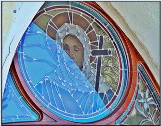
Przyszwice, ko. św. Jana Nepomucena (zdz. pw) Bydlin, ko. św. Małgorzaty (zdz. pw)