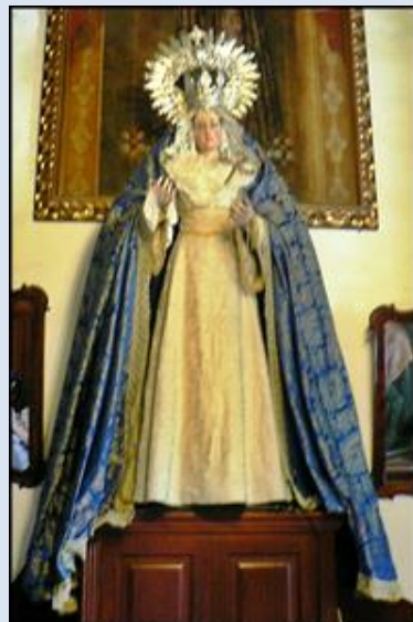
17. Wambierzyce, fg na kolumnie z ok. XIX w. – k. baz. – Sankt. MB;