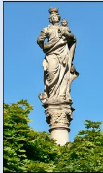
10. Głogówek, OPL, fg na kolumnie k. Ratusza; 11/Radków, DLN, fg z XVIII na kolumnie – Rynek;