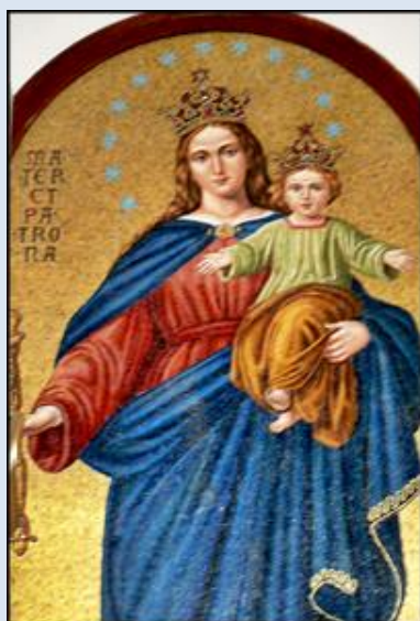
30. Izrael – Jerozolima, ob. w baz.