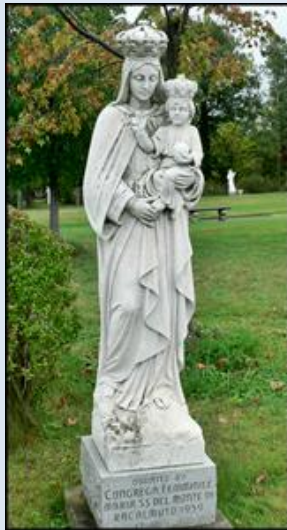
21. USA – Amerykańska Fatima, fg z 1960 r. - k. Sankt. MB Fatimskiej;