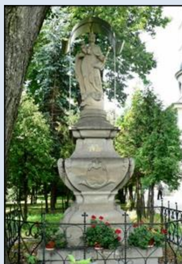
77. Gdynia - Witomino, fg na kolumnie k. ko Podw. Krzyża Św.;