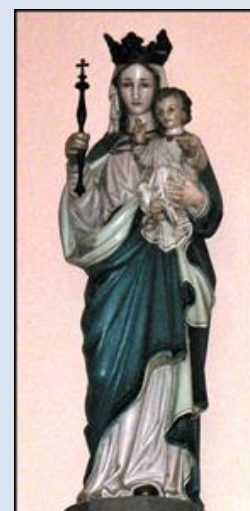
65. Kraków, fg w ko św. Maksymiliana; 66. Łódź, fg w ko św. Alberta; 67. Łódź, fg w kp NSPJ – ko św. Kazimierza;