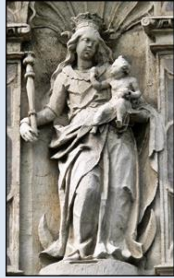
14. Szalejów Dolny, DLN, fg przyd.