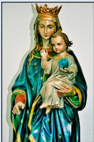
27. Niemcy – Schloss Burg, fg w ko paraf.