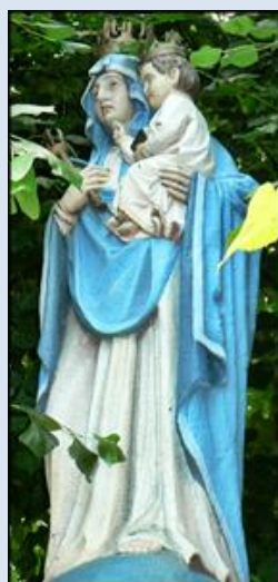
33. Gdańsk – Oliwa, fg baz. Trójcy Przenajśw.