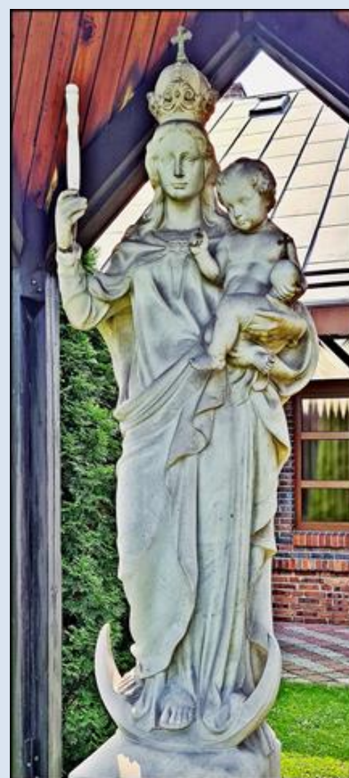
Ruda-Godula, na fasadzie ko. pw. Ścięcia św. Jana Chrzciciela