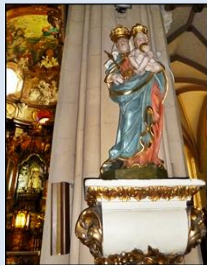
59. Stoczek Warmiński, ob. w baz. Nawiedzenia NMP; 60. Bystrzyca Kłodzka, fg w ko św. Michała Arch.; 61. Kłodzko, w ko WNMP (Jezuitów);