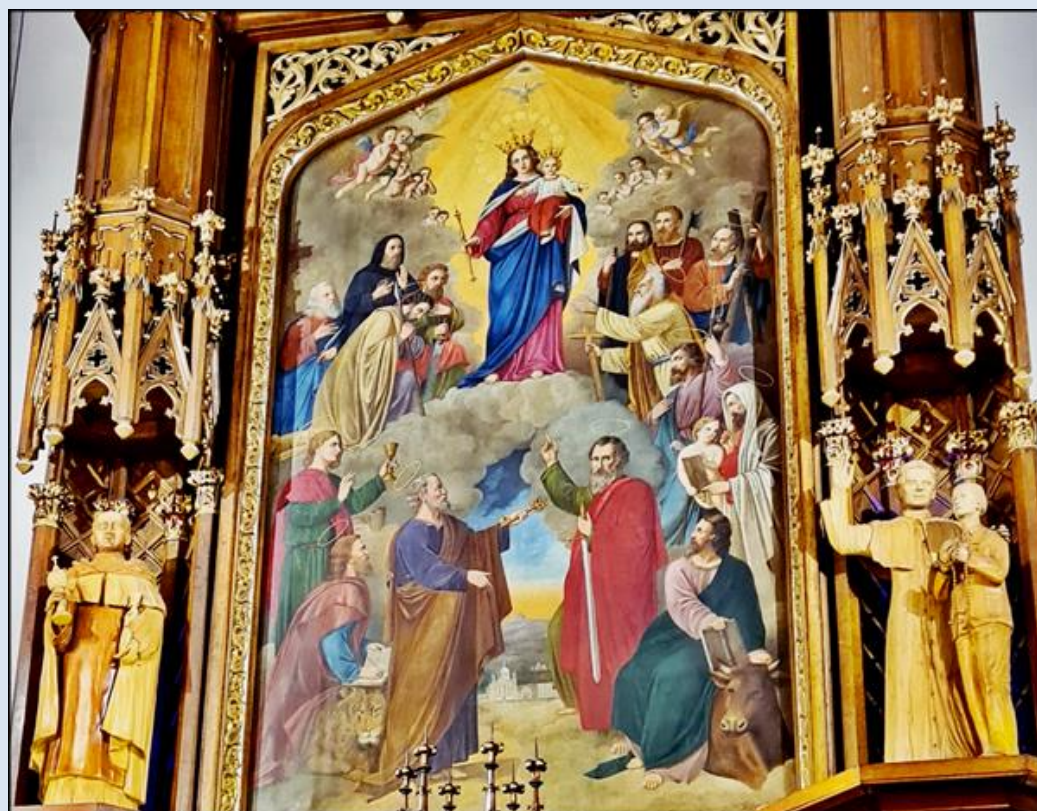
Oświęcim, Sankt. MB Wspomożenia Wiernych - 3