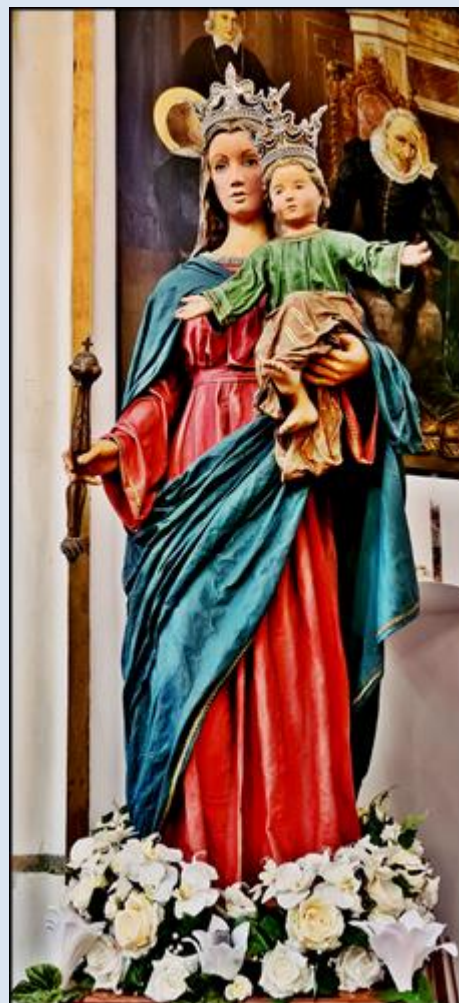
Kędzierzyn-Koźle, Ko. św. Mikołaja (zdj. pw) Oświęcim, Sankt. MB Wspomożenia Wiernych (zdj. pw) - 2