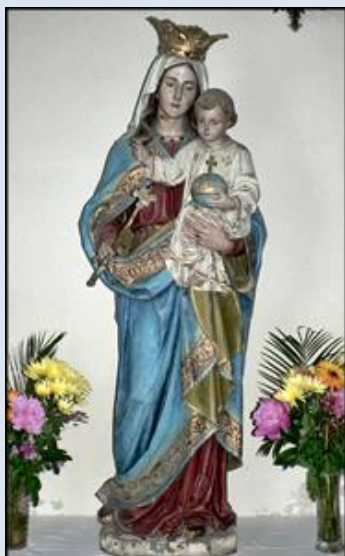
28. Wilkanów, DLN, fg