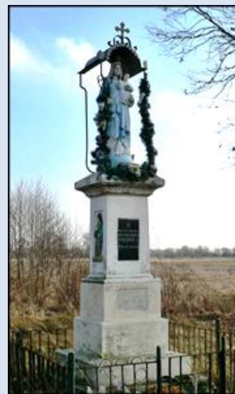
12. Ratno, DLN, fg na kolumnie z ok. XVIII w. 13. Rudy Lisie, MAŁ, fg z 1951 r. – przyd.