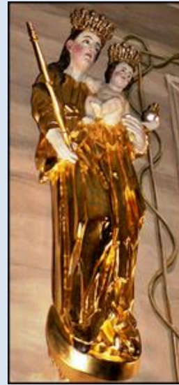
70. Małe Ciche, MAŁ, fg drew. w ko św. Józefa; 71. Łąpsze Wyżne, MAŁ, fg w kp k. ko św. Ap. P. i P. 72. Czarny Potok, fg w ko św. Marcina;