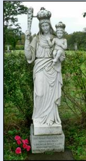
20. Teneryfa – Santa Cruz, fg na kolumnie;