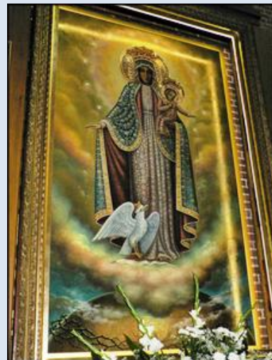
73. Nowy Wiśnicz, MAŁ, fg w ko WNMP; 74. Warszawa, fg w ko św. Andrzeja Boboli; 75. Gdynia, ko św. Antoniego;