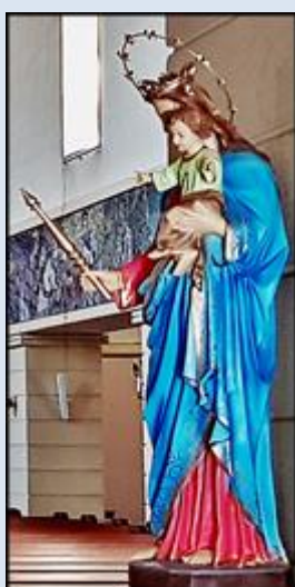
79. Łódź, fg w ko NMP Królowej Polski; [brak]