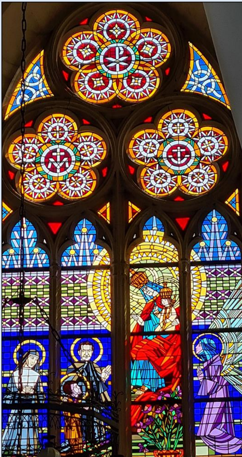
Oświęcim, Sankt. MB Wspomożenia Wiernych (zdj. pw) - 1