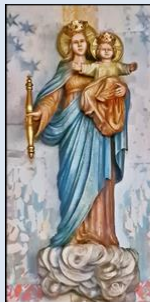
Ruda Śląska, Sankt. św. Józefa (zdj. pw) Jaroszewiec, Sanktuarium NMP Wspomożenia Wiernych (zdj. pw)