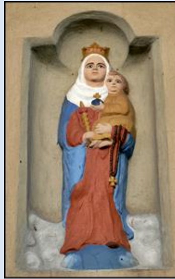
8. Mokrzyńska, fg z 1869 r. – przyd. 9. Przyborów, MAŁ, pł. w ka z 1885 r.;