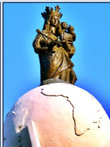
76. Gdynia, ob. w ko NMP Królowej Polski;