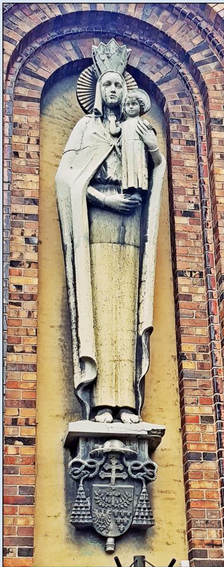
Gliwice, na fasadzie ko. św. Alberta