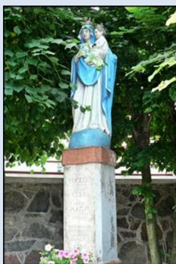
32. Działoszyn, fg k. ko św. M. Magdaleny;