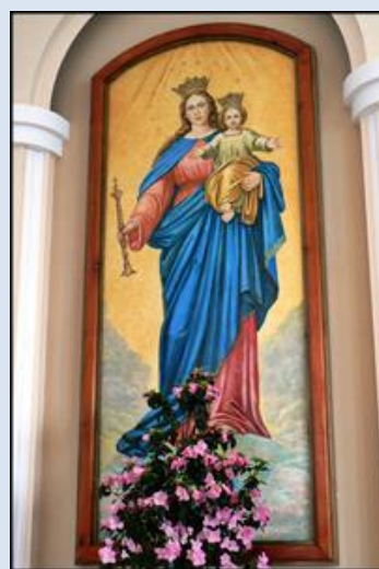
62. Gidle, ŁDZ, ob. w ko św. M. Magdaleny; 63. Wieluń, fg w Sankt. MB Pocieszenia; 64. Kadłub, ŁDZ, ob. w ko św. Jadwigi Śl.