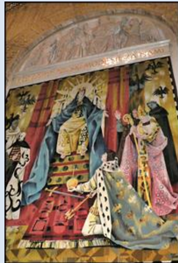
22. USA – Amerykańska Fatima, fg z 1959 r. - k. Sankt. MB Fatimskiej;