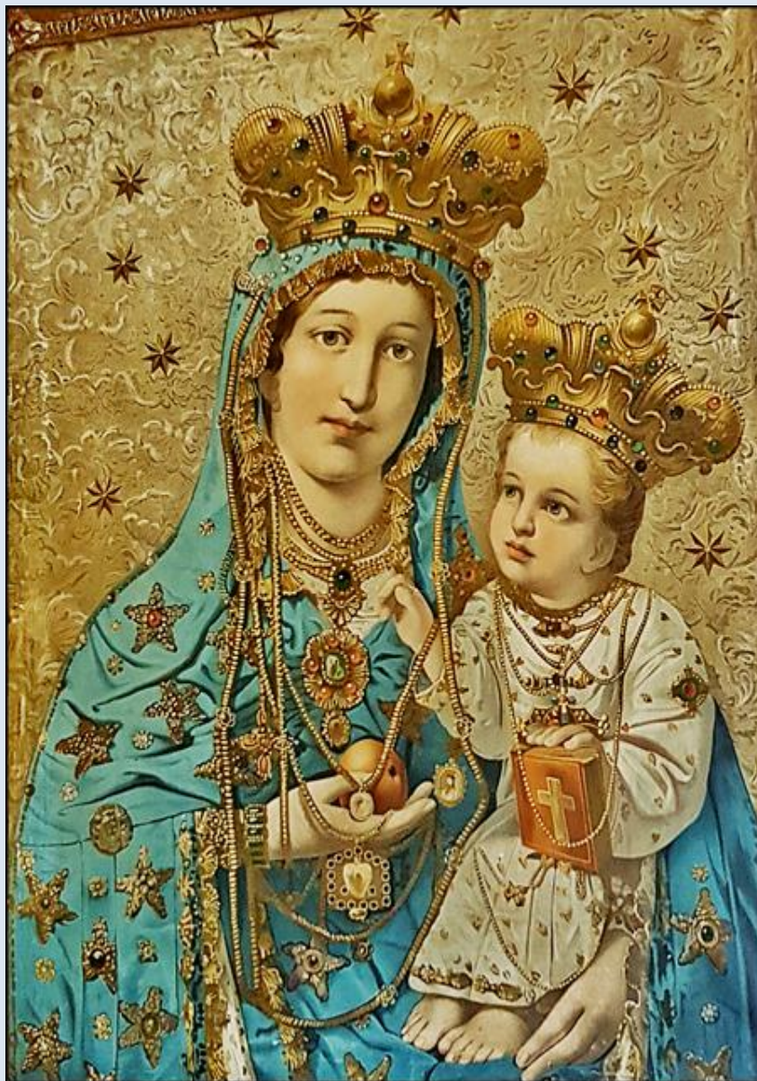
Świętochłowice-Zgoda, Kościół pw. św. Józefa Robotnika (zdz. pw)