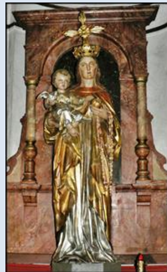
25. Szczurowa, MAŁ, fg z 1891 r. – przyd.