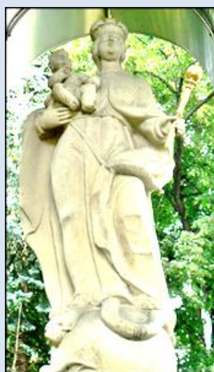
78. Żywiec, fg z 1756 r. k. kolegiaty;