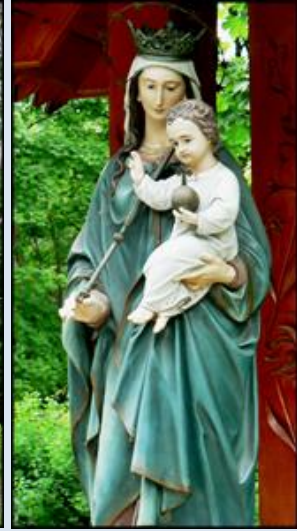
68. Łódź, fg w ko św. Teresy od Dz.J. 69. Zakopane, w ko NMP Królowej Świata;