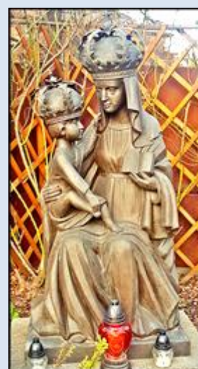
Gliwice-Sośnica, NMP Wspomożenia Wiernych (zdz. pw)