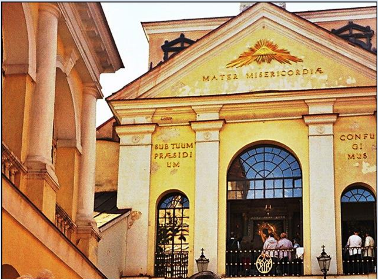
MATKO MIŁOSIĘDZIA POD TWOJĄ OBRONĘ UCIEKAMY SIĘ