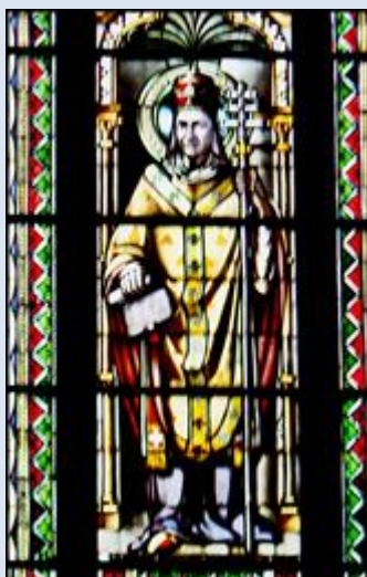
L6,4- Inowrocław, wt w ko Zwiastowania NMP