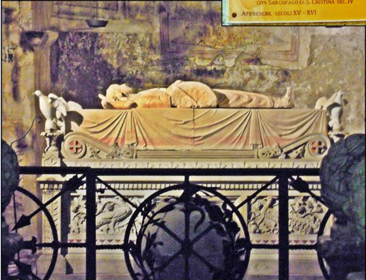
Włochy, Bolsena, krypta w Bazylice pw. św. Krystyny z Bolseny