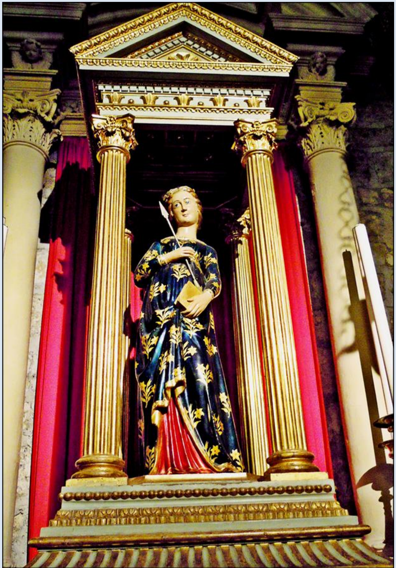
Włochy, Bolsena, Bazylika pw. św. Krystyny z Bolseny