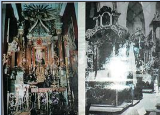
Wnętrze główny Kruszwicy z obrazem przedstawiającym