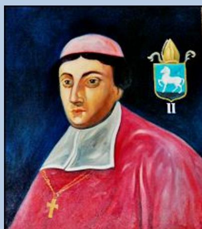
Mauritius Italus ad A o 1014 presuit Ecclesie. Dzwierzchnie tumultatus. de suo Dioccesi optime meritus