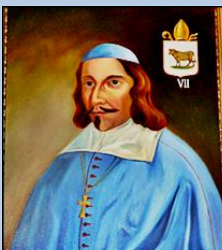
Paulinus Italus electus pietate eximius ad A o 1111 Crusviciensem gubernavit Ecclesiam ibidem tumultatus.