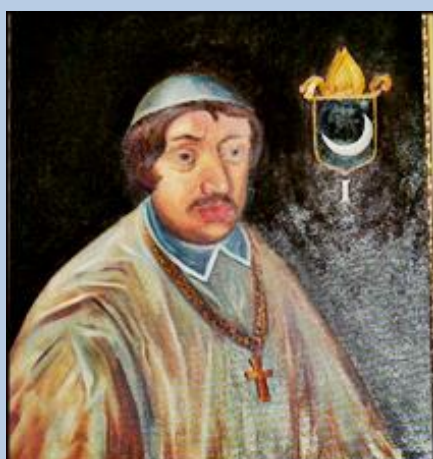
Lucidus Nobilis Status Episcopus Cujavica Crus. ab A o 966. ad 993. rexit Ecclesiam. sepultus Dzwierzchna. Vir Apostolicus. Canonicorum Collegij institutor.