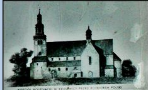
KOSCIÓŁ BOLESLAŃSKI W KRUSZWICY PRZY BOLSZYM POLSKU