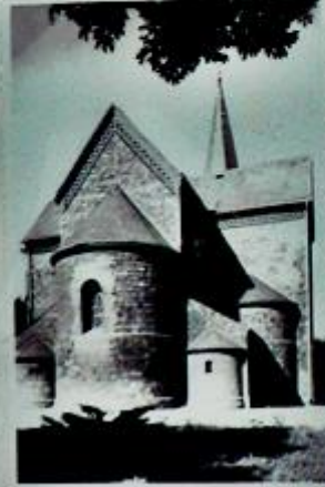
Ceglany fryz neogotycki pod dachem (strona wschodnia)