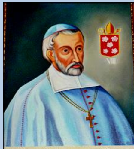
Baldvinus Gallus, promovente Crivousto electus. annis 19 presuit Ecclesie, in Ca- thedrali Crusviciensi tumultatus 1128