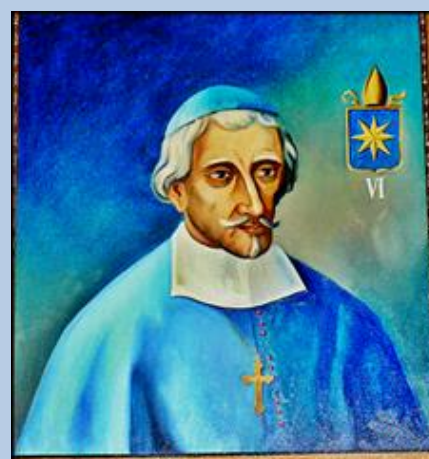
Joannes Romanus unanimi voto electus ob pieta- tem et prudentiam a cunctis predilectus pri- mus Episcopus in eadem ecclesia sepultus A o 1036