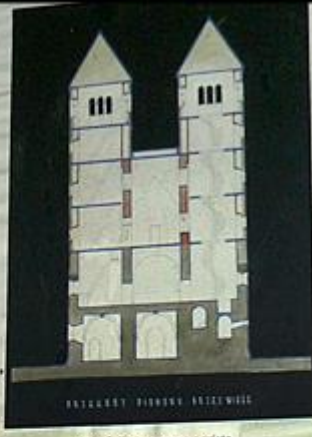
Widok panoramiczny przez wieże