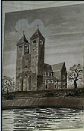
Widok panoramiczny z południa w stronę Kruszwicy