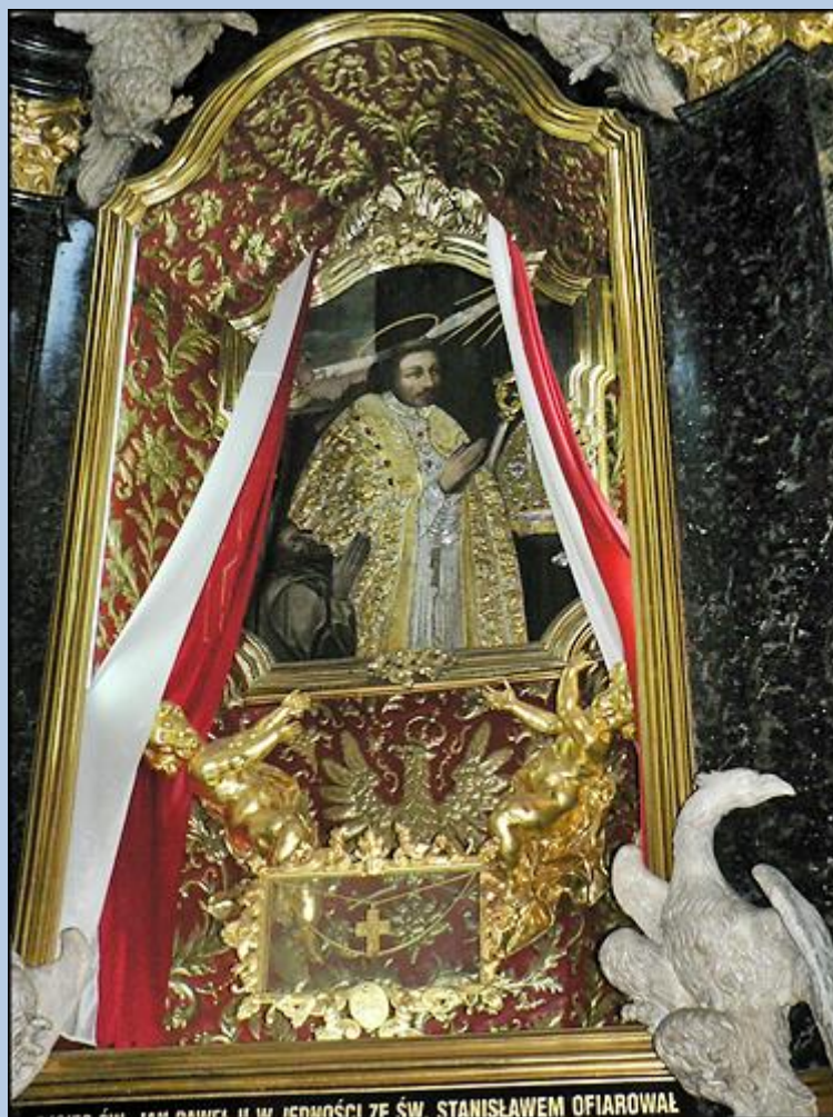
OJCIEC ŚW. JAN PAWEŁ II W JEDNOŚCI ZE ŚW. STANISŁAWEM OFIAROWAŁ