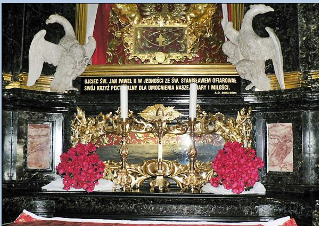
OJCIEC ŚW. JAN PAWEŁ II W JEDNOŚCI ZE ŚW. STANISŁAWEM OFIAROWAŁ SWÓJ KRZYŻ PEKTYDALNY DLA UMOCNIEŃ NASZEJ WIERZY I MIŁOŚCI. A.D. 2003/2004