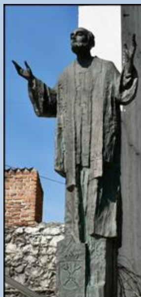
Ołtarz Trzech Tysiącleci