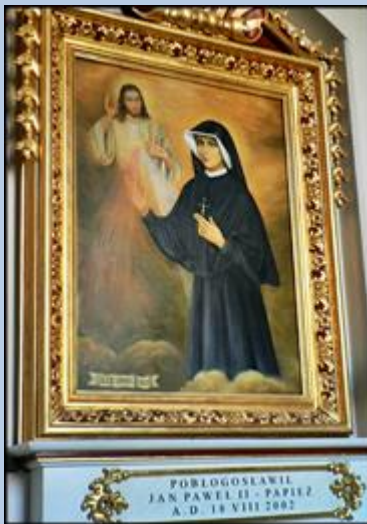
POBLOGOSLAWIL JAN PAWEŁ II - PAPIEŻ A. D. 14 VIII 2002