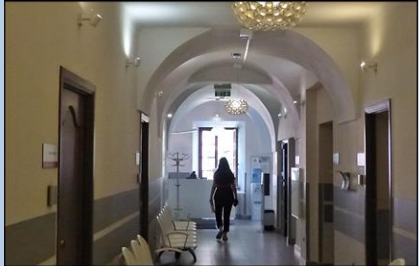
Kościół Trójcy Przenajświętszej OO. Bonifratrów