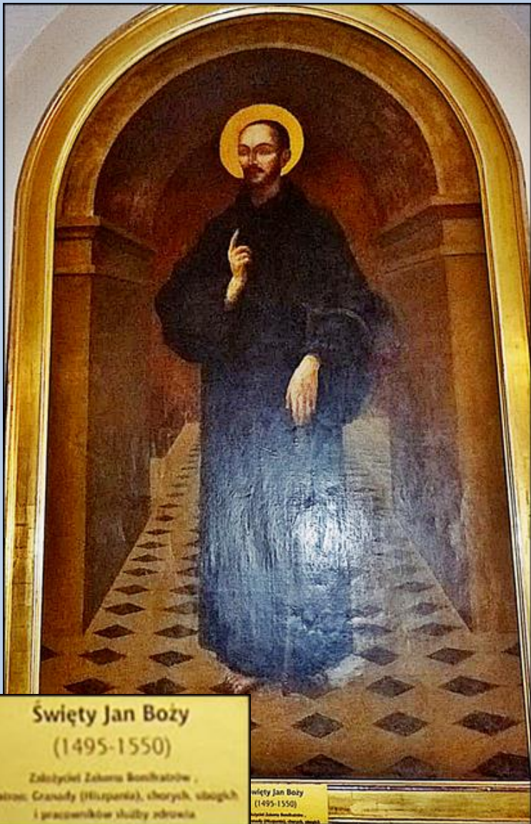
Święty Jan Boży (1495-1550)

Zakazytel Zeharu Bonifratów, Patron: Granady (Hiszpania), chorych, sługów i pracowników służby zdrowia