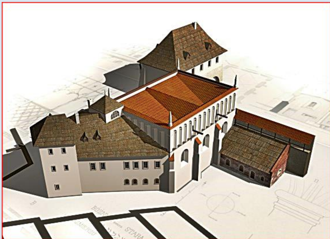
Stara Synagoga od strony południowo-zachodniej