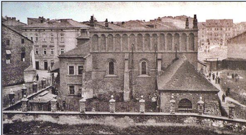
Stara Synagoga, widok od południa z zabudową u wylotu ulicy Józefa i panoramą ulicy Szerokiej. Stan po restauracji według projektu Zygmunta Hendla, ukończony w 1924 r.