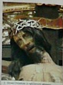
2. Obraz Chrystusa z Matką Maryją, z XVIII w. w niszy głównej.