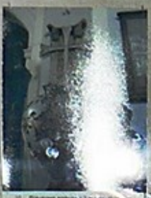
9. Rzeźbiona pręta 17. października.