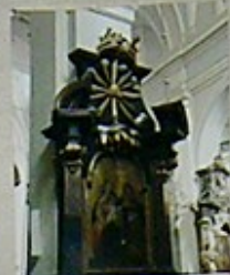
21. Obraz św. Karola, z 1780 roku, w niszy głównej.