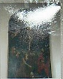
12. Obraz Chrystusa z 1780 roku, w niszy głównej.