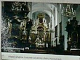
7. Widok wnętrza kościoła z strony drzwi wejściowych.