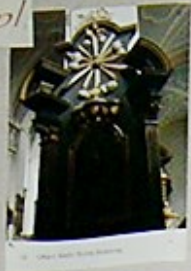
23. Obraz św. Michała z 1780 roku, w niszy głównej.

Więcej zdjęć na stronie internetowej: www.swietymarek.pl