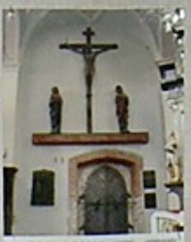
15. Obraz Chrystusa z 1780 roku, w niszy głównej.