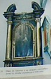
19. Obraz św. Karola, z 1780 roku, w niszy głównej.