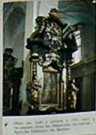
18. Obraz św. Michała z 1780 roku, w niszy głównej.