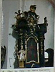
14. Obraz św. Michała z 1780 roku, w niszy głównej.