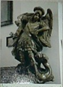
6. Rzeźba Michała Anioła, w niszy głównej, z 1780 roku.