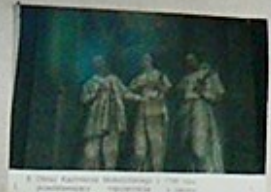
8. Obraz Kapłanów w szatach, z XVIII w. w niszy głównej.