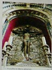
1. Krzyż w niszy główny.