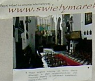
22. Widok wnętrza kościoła z strony drzwi wejściowych.