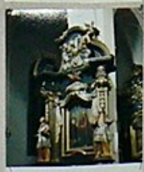
16. Obraz św. Karola, z 1780 roku, w niszy głównej.