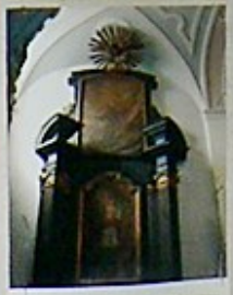
20. Obraz św. Michała z 1780 roku, w niszy głównej.