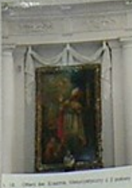
17. Obraz św. Józefa z 1780 roku, w niszy głównej.