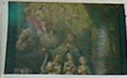
11. Obraz św. Józefa z Dzieciątkiem Jezus, z 1780 roku, w niszy głównej.