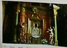
4. Obraz Matki Boskiej z Dzieciątkiem Jezus, w niszy głównej, z XVIII w. w niszy głównej.