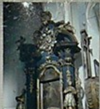
13. Obraz św. Karola, z 1780 roku, w niszy głównej.