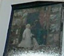
5. Obraz z około 1824 roku, przedstawiający św. Michała z aniołami, w niszy głównej.