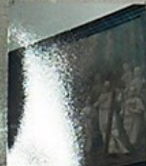
10. Obraz Anioła Michała z 1780 roku, z aniołami w niszy głównej.