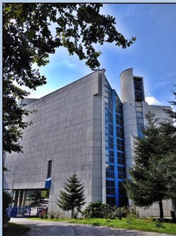
zdjęcia: Jan Nitecki

zdjęcie w czerwonej obwódce zapożyczono z: http://swietajadwiga.diecezja.pl/clients/_jadviga/_upload/_foto/209_1307006340.jpg