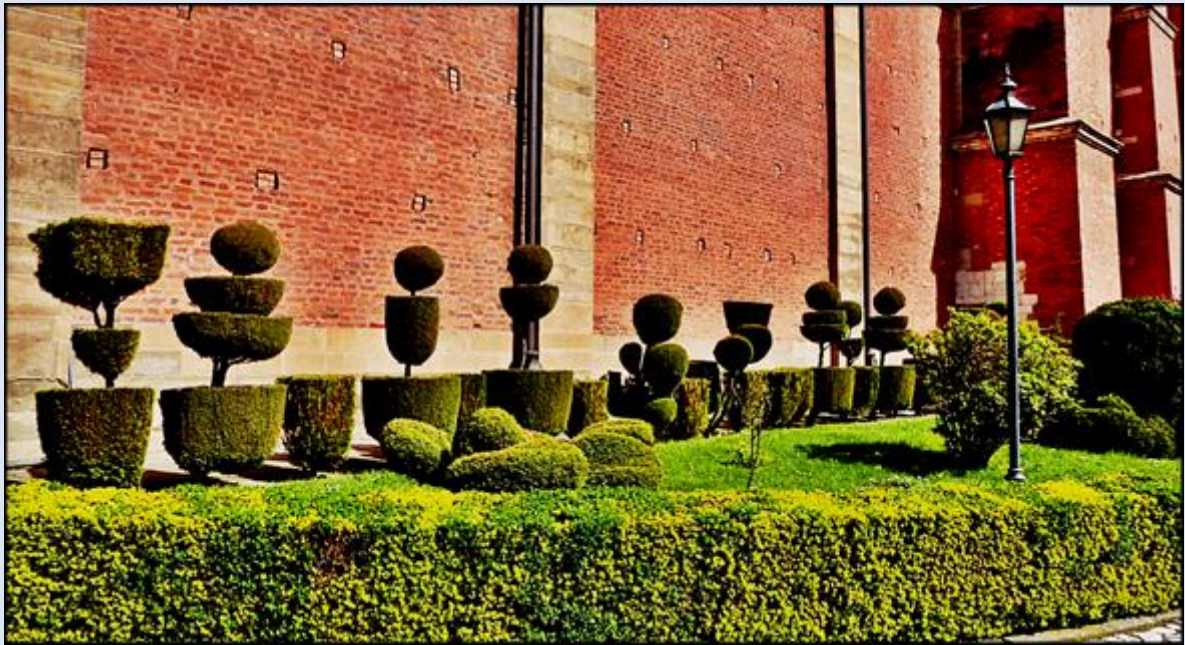
w tle: ściana boczna Kościoła św. Piotra i Pawła