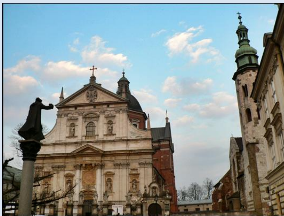
Na wprost Kościół św. Piotra i Pawła (i posąg św. Piotra Skargi), z prawej – Kościół św. Andrzeja Apostoła