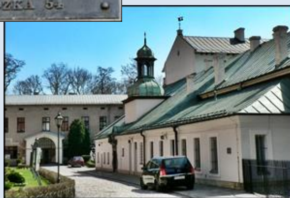
po lewej – Kościół św. Piotra i Pawła (ul. Grodzka 52) po prawej – Kościół św. Andrzeja (ul. Grodzka 54 - klaryski)