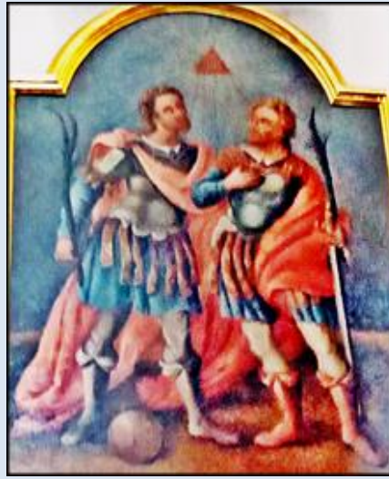
4. Hiszpania- Barcelona, ob. w baz. św. Eulalii; P1880199- 10.VII.'12 Warta, ko. św. Mikołaja