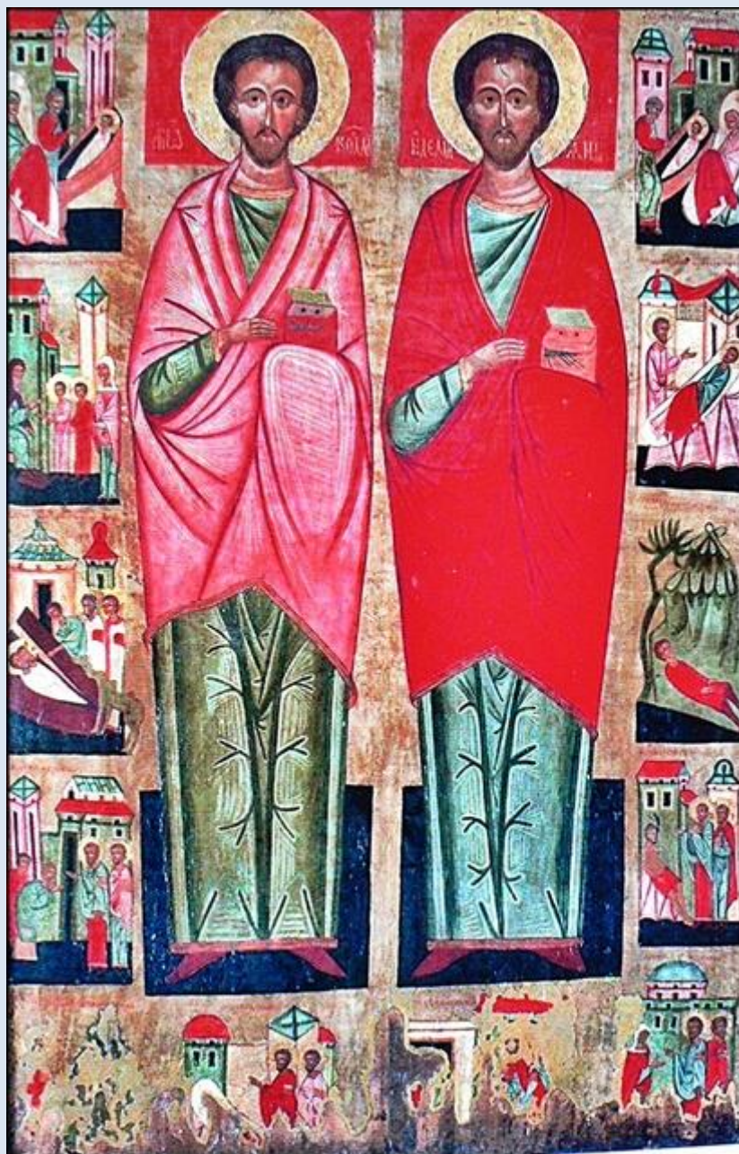
Tylicz, Cerkiew pw. Kosmy i Damiana

zobacz: Święci w Polsce i ich kult w świetle historii http://sancti-in-polonia.wietrzykowski.net/2k.html http://sancti-in-polonia.wietrzykowski.net/7k.html