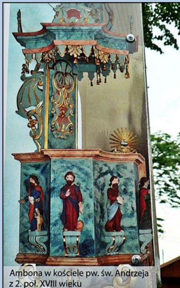
Ambona w kościele pw. św. Andrzeja z 2. poł. XVIII wieku