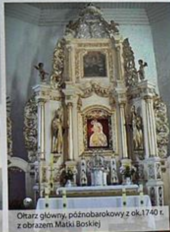
Ołtarz główny, późnobarokowy z ok. 1740 r. z obrazem Matki Boskiej