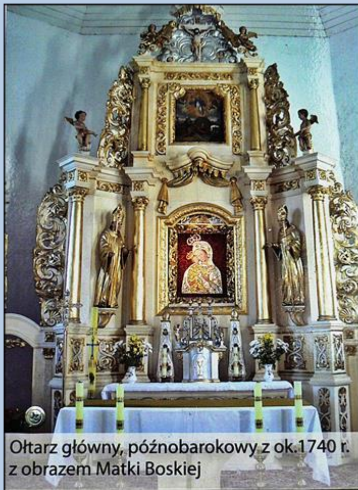
Ołtarz główny, późnobarokowy z ok. 1740 r. z obrazem Matki Boskiej