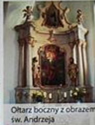
Ołtarz boczny z obrazem św. Andrzeja