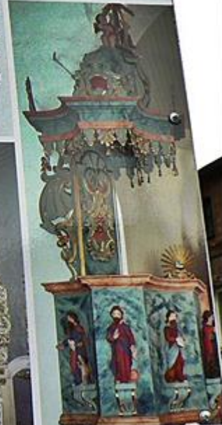
Ambona w kościele pw. św. Andrzeja z 2. poł. XVIII wieku

barokowo-rokokowe, z interesującym późnobarokowym ołtarzem głównym z 1740 r., w którym podziwiać można obraz „Matki Boskiej Miłującej z Dzieciątkiem” w sukience.