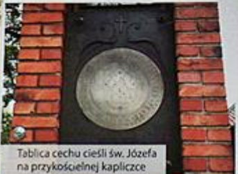
Tablica cechu cieśli św. Józefa na przykościelnej kapliczce