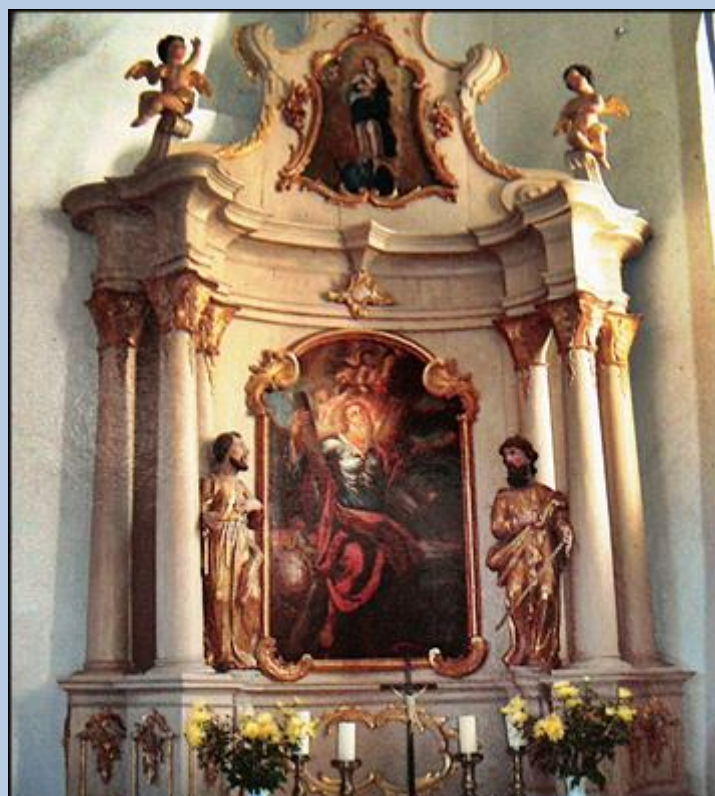
Ołtarz boczny z obrazem św. Andrzeja