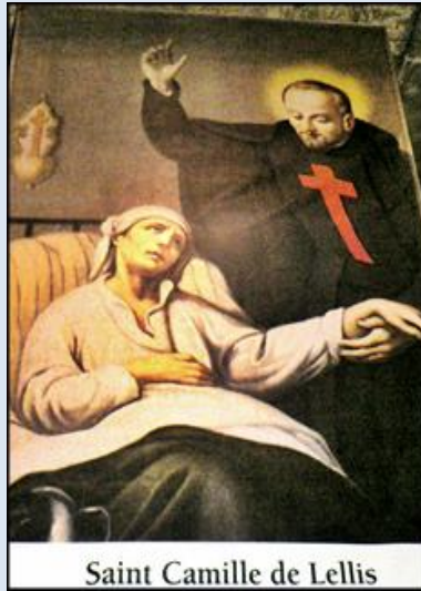
Saint Camille de Lellis