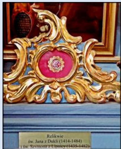
J12,16- Wrocław, wt w kt św. Jana Chrzciciela; J12,17- Rzeszów, fg k. baz. WNMP; J12,18- Rzeszów, rel. w baz. WNMP