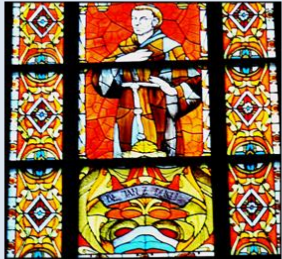
J12,13- Łódź, wt w ko św. Alberta Chmielowskiego; J12,14- Warszawa, fg w ko św. Karola Boromeusza; J12,15- Warszawa, wt w ko św. Ap. Piotra i Pawła;