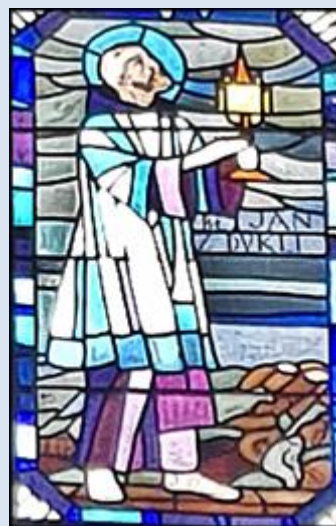
Oświęcim, Sankt. MB Wspomożenia Wiernych (zdj. pw) Katowice-Piotrowice, ko. NSPJ (zdj. pw) Świętochłowice-Lipiny, ko. św. Augustyna (zdj.pw)