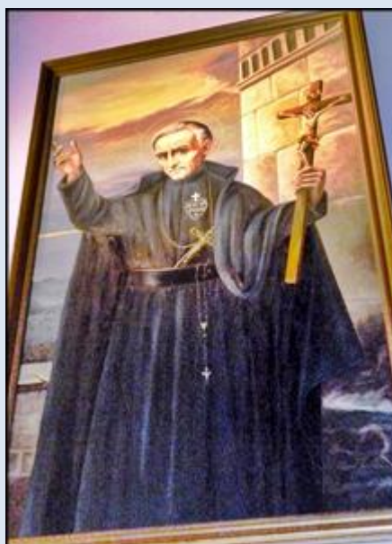
4. Częstochowa, wt w ko Św. Krzyża;