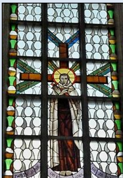
3. Czerna, MAŁ, ob. z XVIII w. w kp św. J.o.K. w klasztorze karmelitów;