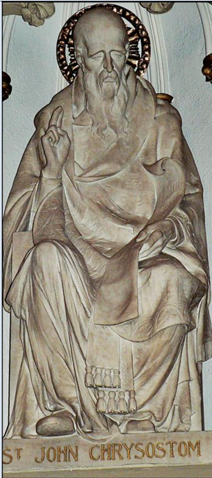
USA – Nowy Jork, w Katedrze pw. św. Patryka

zobacz: Święci w Polsce i ich kult w świetle historii http://sancti-in-polonia.wietrzykowski.net/2j.html http://sancti-in-polonia.wietrzykowski.net/7j.html