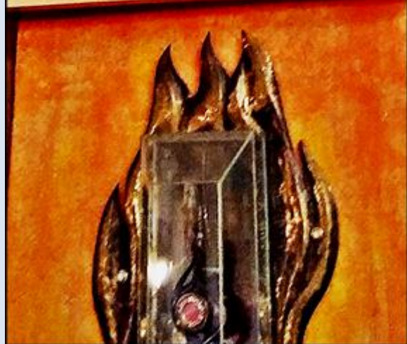
Rzeszów, ob. i rel. w ko św. Józefa

https://www.brewiarz.pl/czytelnia/swieci/10-24b.php3