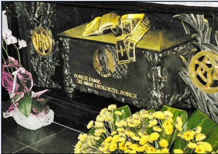
1. Przemyśl, rel. w baz. WNMP i św. Jana Chrzc.;