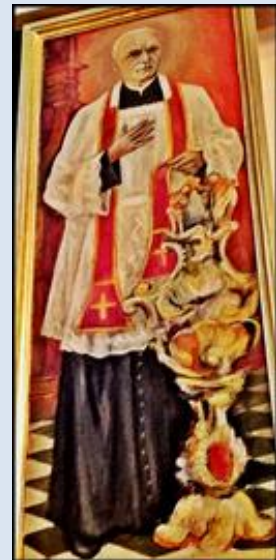
2. Przemyśl, ob. w baz. WNMP i św. Jana Chrzc.; J41,3- Rzeszów, ob. w ko Św. Krzyża; J41,4- Rzeszów, ob. i rel. w ko św. Józefa; [p. str. 1]