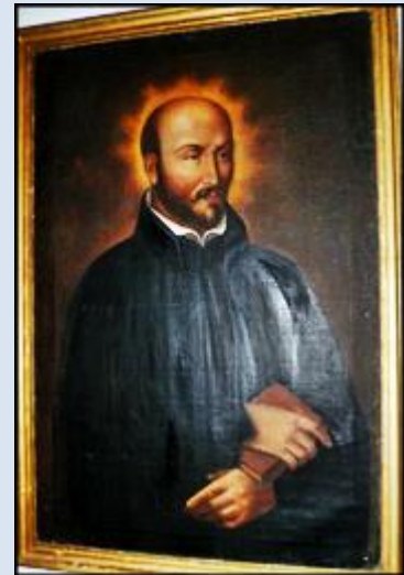
13. Rzym, ob. w baz. S. Ignazio; P1790486 „ 14. Kraków, fg w ko śś. Piotra i Pawła; 15. Krasnystaw, LBL, ob. w Muzeum Regionalnym;