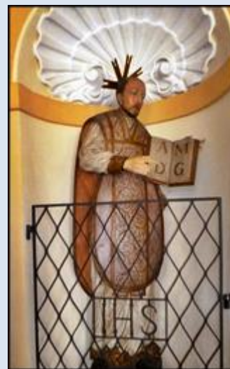
16. Łódź, ob. w ko Podwyższenia Krzyża Św.; 17. Bystrzyca Kłodzka, DLN, ko św. Michała Arch.; 18. Kłodzko, fg w ko WNMP;