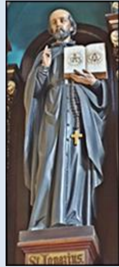
II,27- Piotrków Trybunalski, ob. w ko św. Franciszka Ksawerego; Gliwice-Żerniki, ko. św. Jana Chrzciciela Gliwice, ko. MB Kochawińskiej Ruda-Kochłowice, ko. Świętej Trójcy