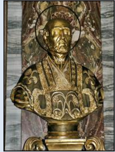
10. Swidnica, DLN, fg w kt śś. Stanisława i Waclawa; 11. Piotrków Tryb., fg w ko św. Franciszka Ksawerego; 12. Rzym, pop. w baz. S. Ignazio; P1790472- 28.03.'12.