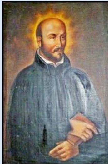
II, 28 – Częstochowa, ob. w Muzeum Archidiecezjalnym;