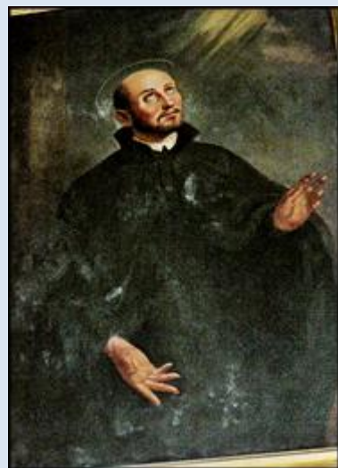
11,24 – Katowice, fg w ko św. Józefa; 11,25- Katowice- Szopienice, fg w ko św. Jadwigi Śl. 11,26- Toruń, ob. w ko Św. Ducha