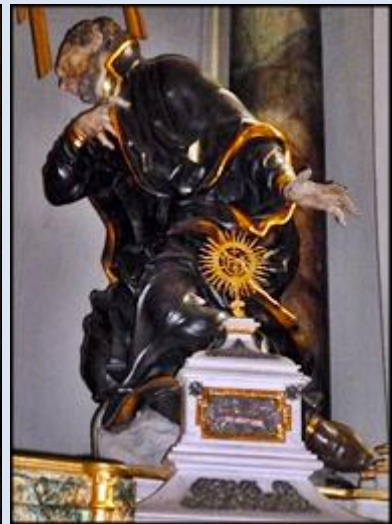
19. Nowe Miasto n. Pilicą, ob. w ko św. Kazimierza; 20. Kłodzko, fg 2 w ko WNMP;