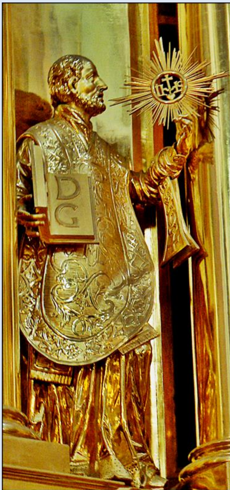
Piotrków Tryb., fg w ko św. Franciszka Ksawerego