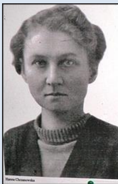
4. Kraków, kopia zdjęcia, w ko. św. Szczepana; P2700657 – 28.IV.'18.