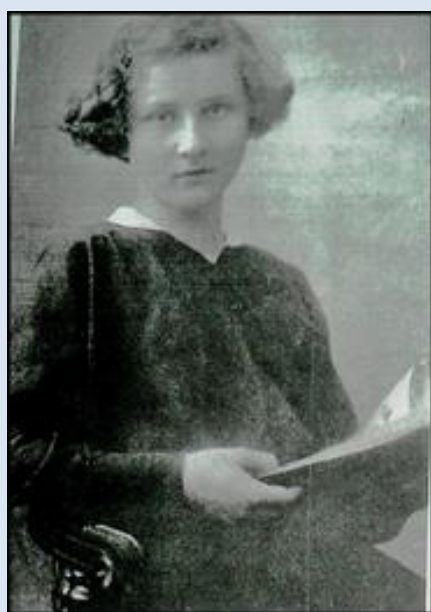
3. Kraków, kopia zdjęcia, w ko. św. Szczepana; P2700656 – 28.IV.'18.