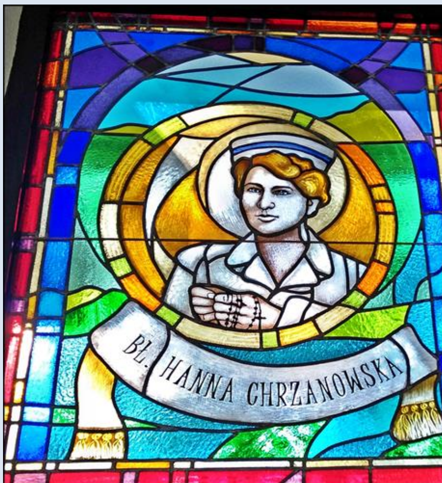
H16,5- Radomsko, wt w ko NSPJ