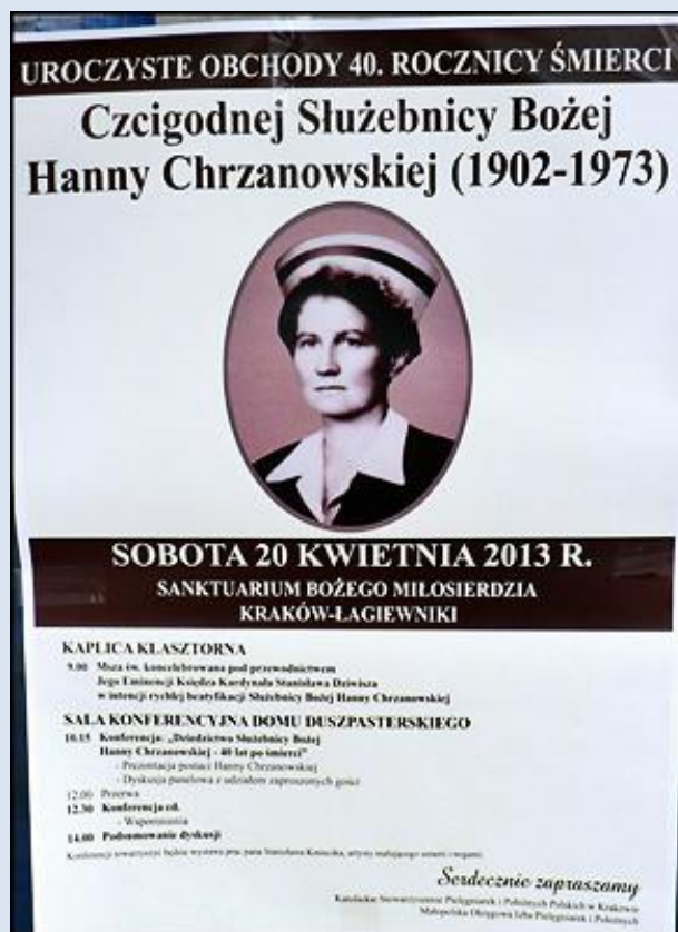
1. Kraków, plakat k. ko Arka Pana

https://hannachrzanowska.pl/sample-page/