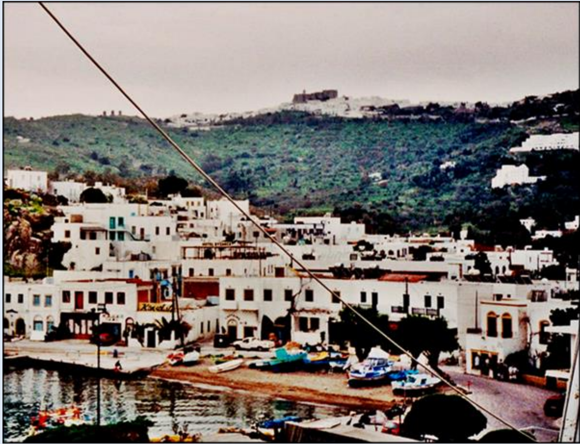
Klasztor na szczycie góry