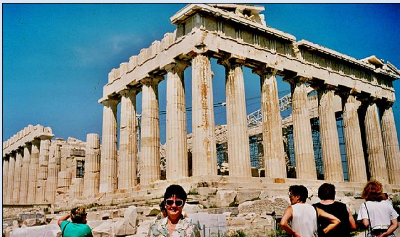
Przed Parthenonem, główną świątynią Akropolu

http://athenae-antiquae.wietrzykowski.net/ http://athenae-antiquae.wietrzykowski.net/Akropol.html