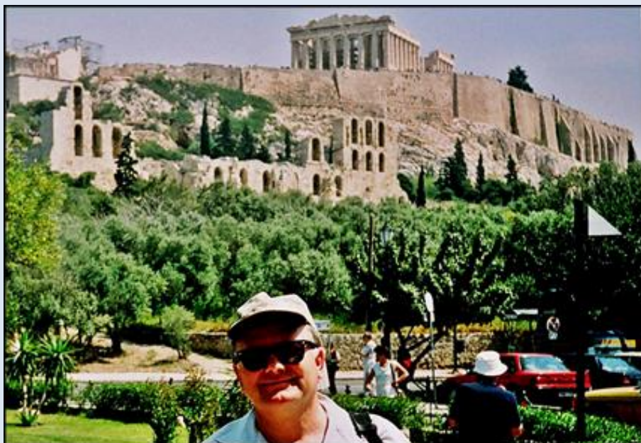
widok na Akropol z południowo-zachodniej strony

http://athenae-antiquae.wietrzykowski.net/ http://athenae-antiquae.wietrzykowski.net/Akropol.html