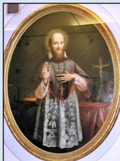
10. Włochy - Turyn, ob. 2 w ko św. Franciszka Salezego; P1840 296- „