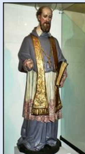
9. Włochy - Turyn, ob. w ko św. Franciszka Salezego; P1840276- 1.VII.'12.