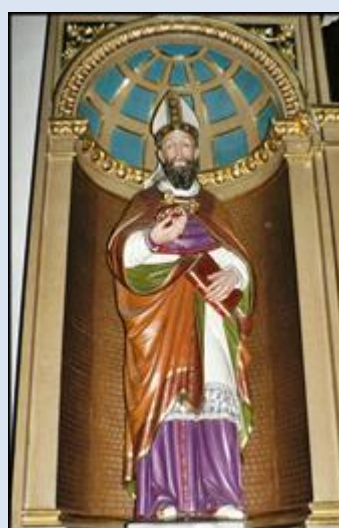
13 . Włochy - Turyn, fg pch w ko NMP;