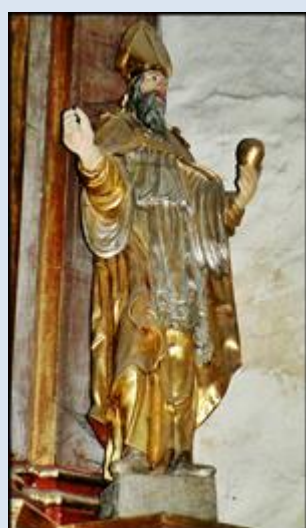
12. Włochy - Turyn, ob. w Muzeum św. Jana Bosko; P1840415- „