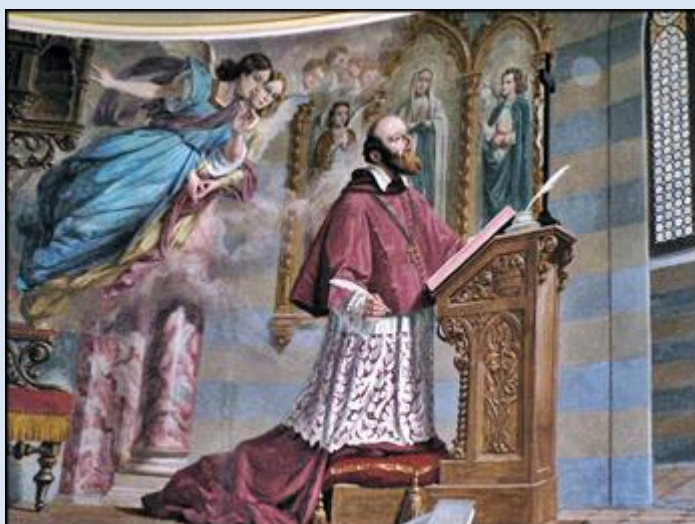
11. Włochy - Turyn, fg w Muzeum św. Jana Bosko; P1840364- „