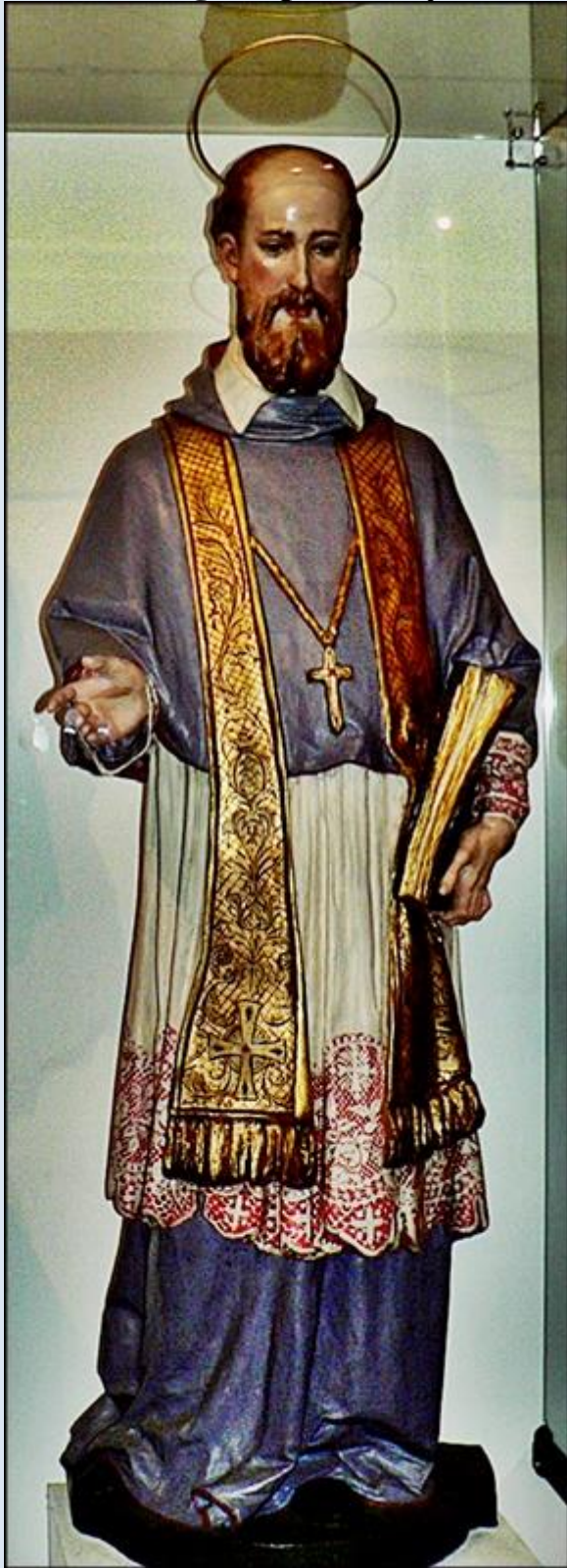
Włochy - Turyn, fg w Muzeum św. Jana Bosko

zobacz: Święci w Polsce i ich kult w świetle historii http://sancti-in-polonia.wietrzykowski.net/2f.html http://sancti-in-polonia.wietrzykowski.net/7f.html