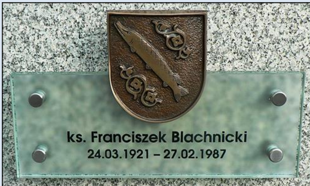
F35,1- Rybnik, pk k. ko MB Bolesnej; P2610892-4,6- 9.IX.'17. cd