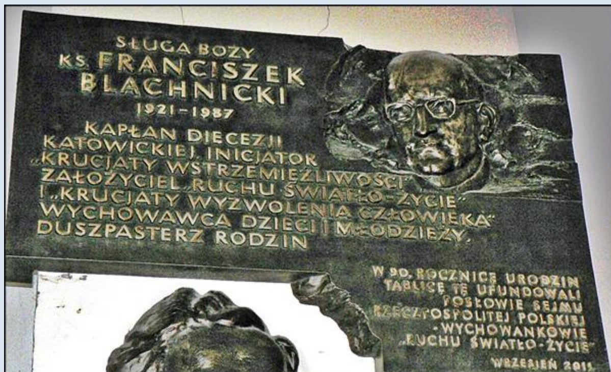
2- Katowice, pł. z tablicą w baz. Chrystusa Króla; P2170294- 11.IV.'15;