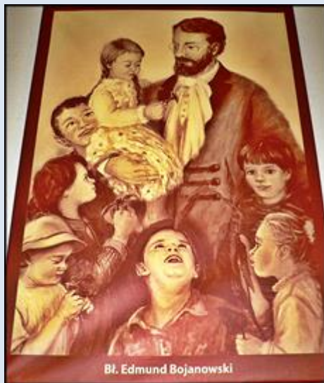
9- Nowy Sącz, ob. w baz. św. Małgorzaty Ant.