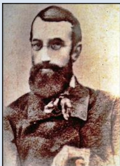
11- Toruń, wiz. w ko św. Józefa;