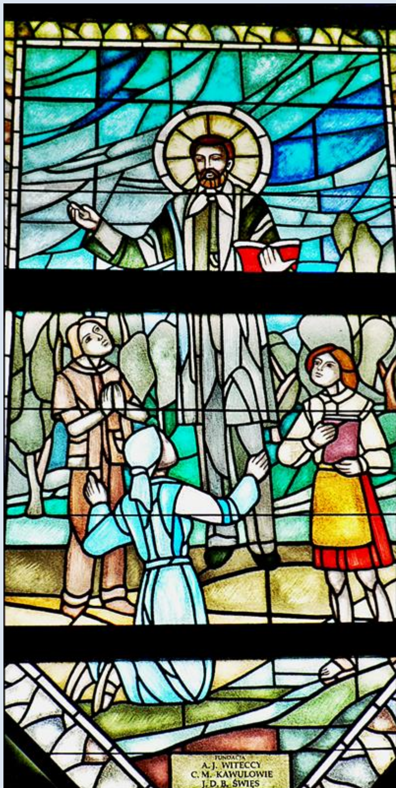
Tylicz, witraż w Kościele pw. Najświętszego Imienia Maryi