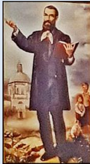
Czeladź, ko. św. Stanisław.BM (zdz. pw) Radzionków, ko. św. Wojciecha (zdz. pw)