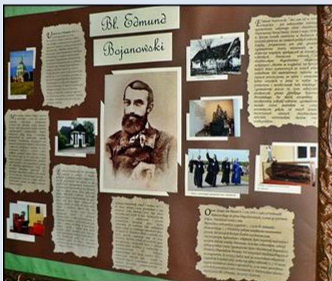
12- Kraków, zdj. kopia w ko św. Szczepana;