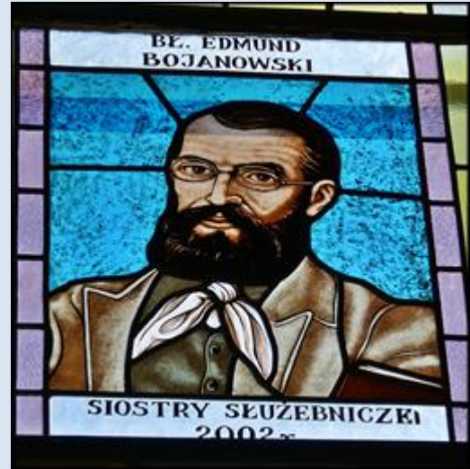
13- Warszawa, ob. w ko Opatrzności Bożej; 14- Warszawa, rel. w ko Opatrzności Bożej; E12,15- Kcynia, KPM, wt w ko WNMP;