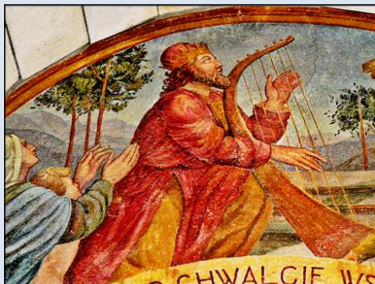
D5,22- Szaflary, MAŁ, fk w ko św. Andrzeja;