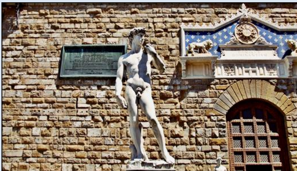
Włochy, Florencja