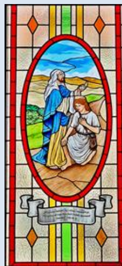
D5,19- Łądek Zdrój, fg w ko Nawiedz. NMP; D5,20- Rączki, PDL, fg w ko paraf.; Zabrze-Zandka, ko. Ducha Świętego