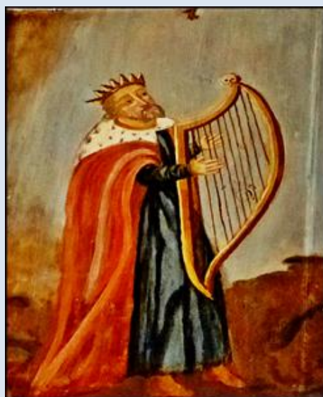
D5,26- Kielce, fg w baz. NMP;