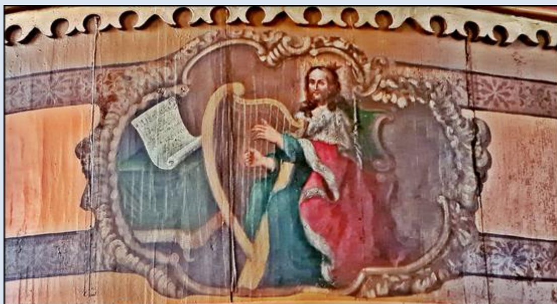
Lędziny, ko. św. Klemensa (zdj. pw)