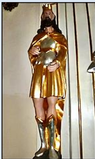
15. Rzym, fg w baz. S. Maria Maggiore; P2070174- 10.IX.'13.