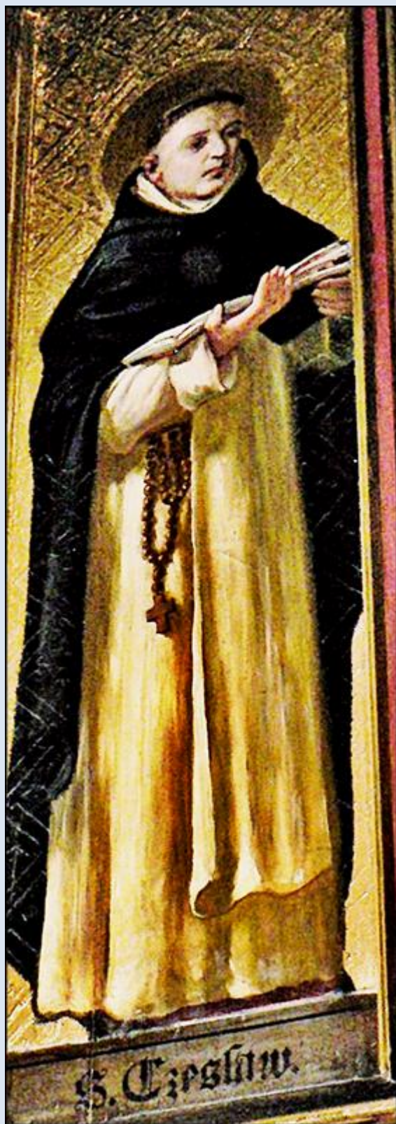
Kraków, Kościół pw. św. Katarzyny

zob. Święci w Polsce i ich kult w świetle historii http://sancti-in-polonia.wietrzykowski.net/2c.html http://sancti-in-polonia.wietrzykowski.net/7c.html