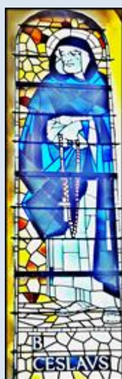
Siemianowice Śląskie, ko. św. Antoniego