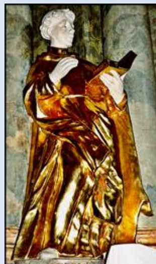
22. Warszawa, fg w ko św. Karola Boromeusza; P2680018.