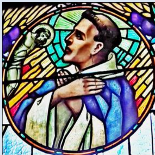
C2,25- Racibórz, fk w ko WNMP;