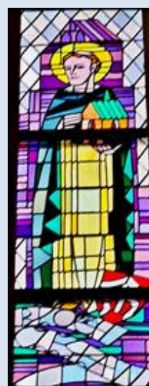
Piekary Śląskie, ko. Świętej Trójcy