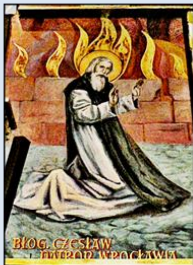
C2,24- Częstochowa, fg w ko św. Zygmunta;