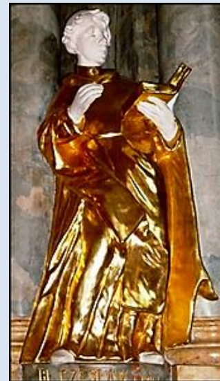
8. Wrocław, rel. w ko św. Wojciecha; 10. Częstochowa, fg w ko św. Zygmunta;