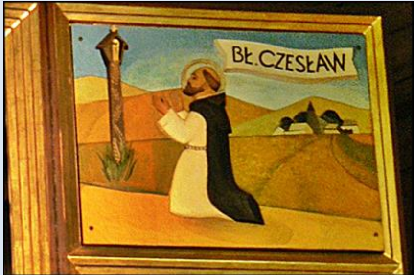
18. Leśnica, MAŁ, pł. w ko paraf.; P2220175- 13.VI.'15.