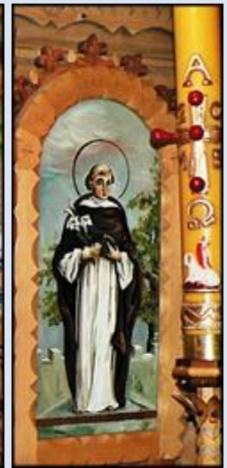
16. Łódź, wt w ko św. Alberta; „ 522- 3.VI.'15; 17. Małe Ciche, MAŁ, ob. w ko św. Józefa; P2220792- 15.VI.'15;