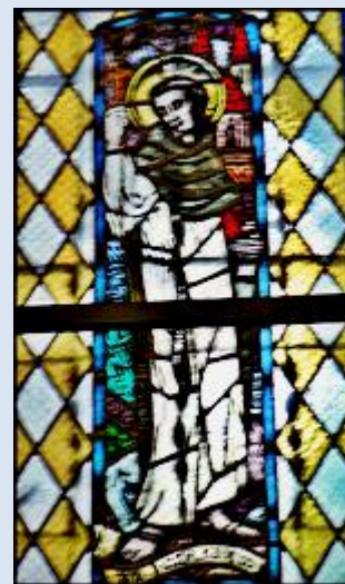
19. Gidle, ŁDZ, fg w baz.; P2260447- 28.08.'15. 20. „ ob. „ „ 450- „ 21. Gdańsk - Wrzeszcz, wt w ko NSPJ; P2270461- 6.IX.'15;