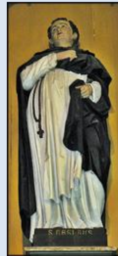
11. Janów Lubelski, LBL, fg w ko św. Jana Chrz.; P1050767- 16.VI.'14. 12. Raczek, PDL, fg w ko paraf. 13. Łódź, fg w ko WNMP; P1760058- 20.II.'12;