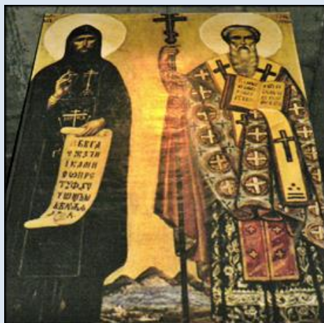
Saints Cyrille et Methode