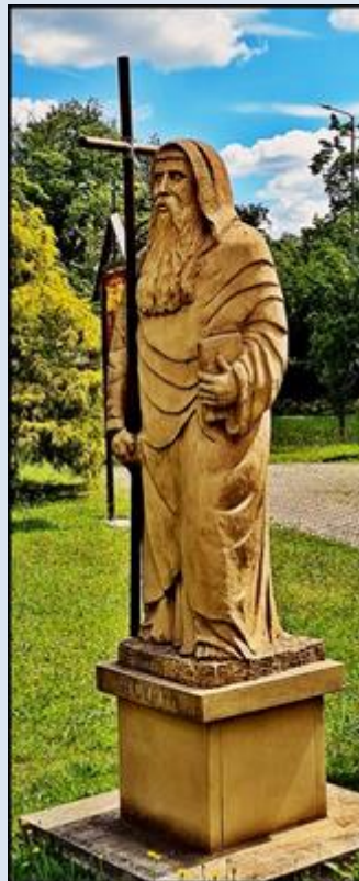
Włochy, podziemia Baz. św. Klemensa przy Lateranie (zdz. as) Knurów, Ko. śś. Cyryla i Metodego (zdz. pw)