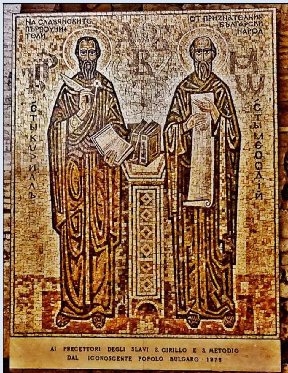
Włochy, podziemia Baz. św. Klemensa przy Lateranie