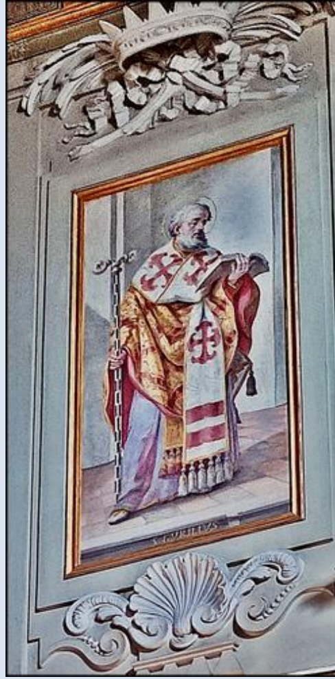
Włochy, podziemia Baz. św. Klemensa przy Lateranie (zdz. as) Włochy, Baz. św. Klemensa przy Lateranie (zdz. as)