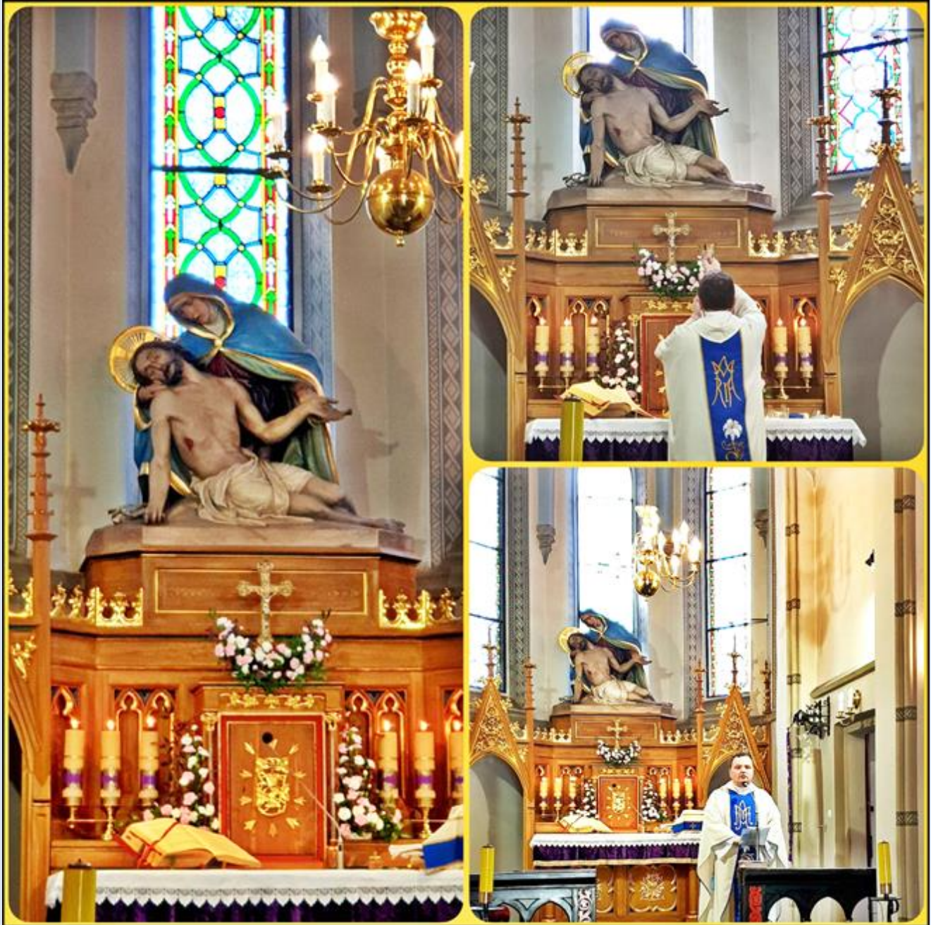
We Wspomnienie MB Bolesnej 15.09.2021 r.