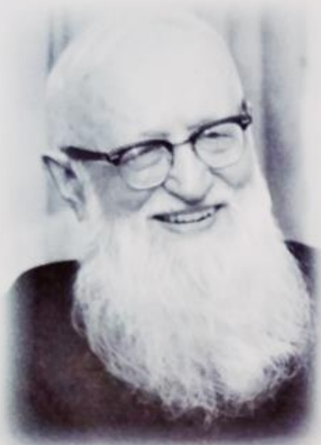
Sługa Boży o. JÓZEF KENTENICH (1885–1968)

Człowiek głębokiej wiary i modlitwy, odznaczający się wielką miłością do Maryi. Matce Trzykroć Przedziwnej powierzył założony przez siebie maryjno-apostolski ruch odnowy, nazywany od miejsca powstania Ruchem Szensztackim (Schönstatt, niem.: „piękne miejsce”). Wspólnoty Ruchu służą Kościołowi na wszystkich kontynentach przez aktywne apostołstwo świeckich i duchownych oraz poprzez kontemplację.