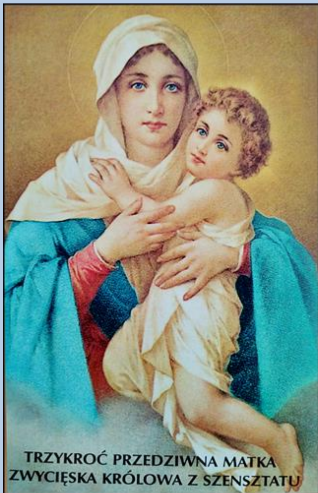
TRZYKROĆ PRZEDZIWNĄ MATKĄ ZWYCIĘSKĄ KRÓLOWĄ Z SZENSZTATU