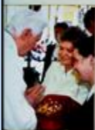
Poświęcenie korony przez Ojca św. Benedykta XVI, kwiecień 2011 r.