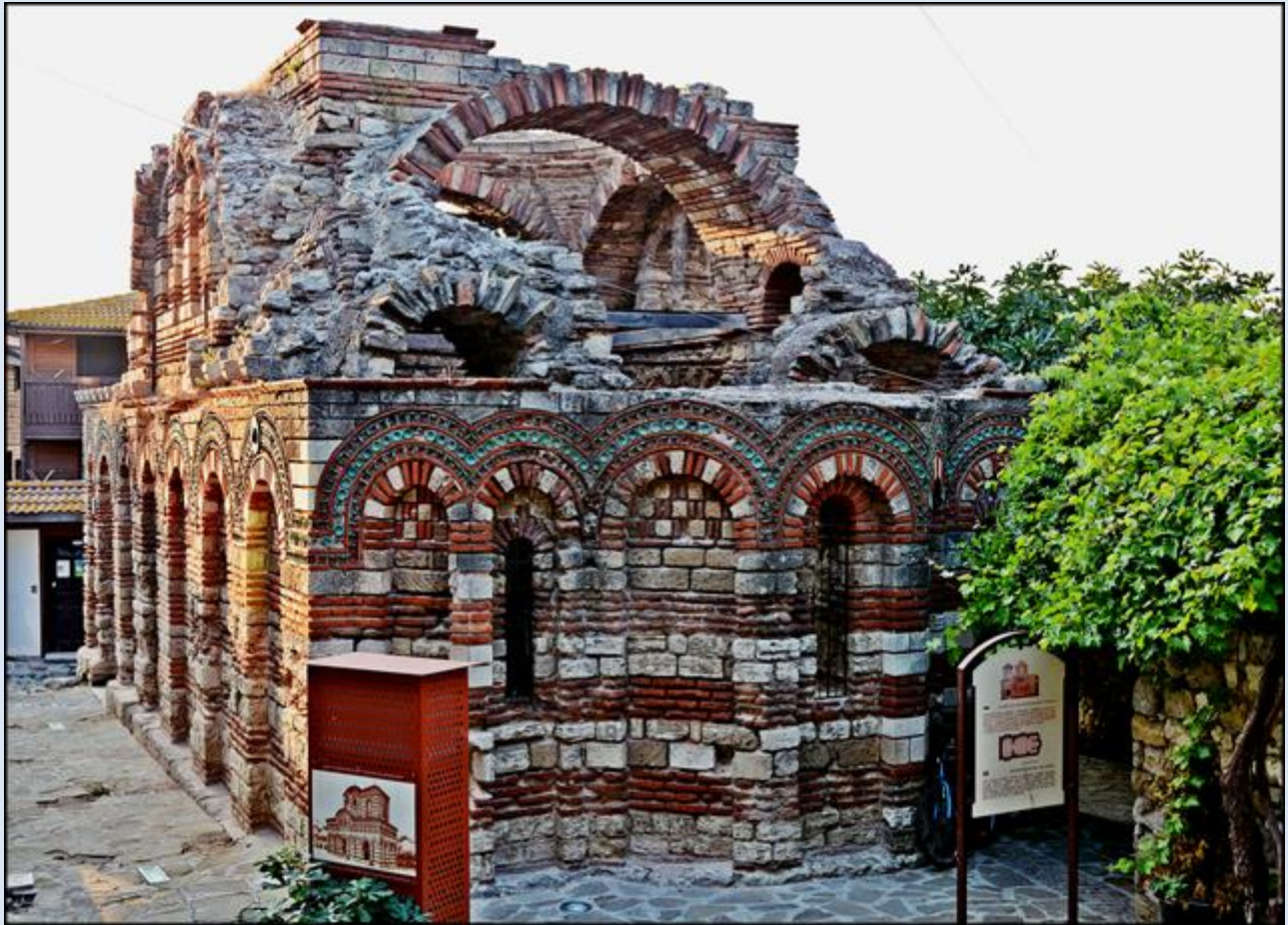
opis: tsw