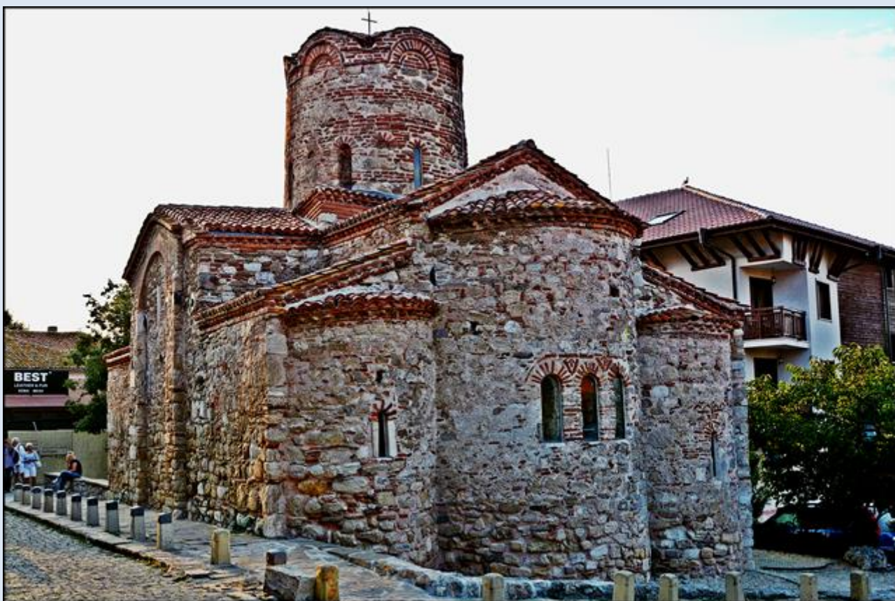
opis: tsw