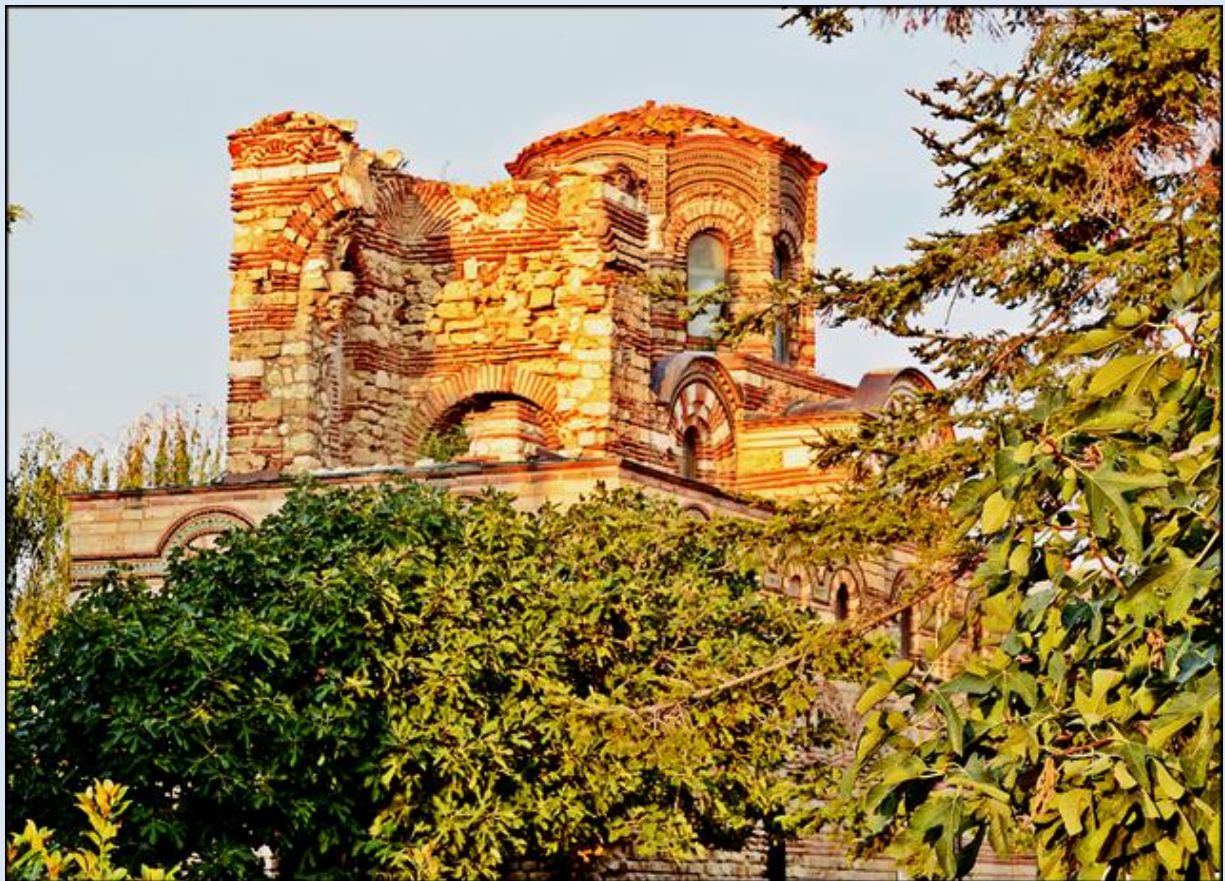
opis: tsw