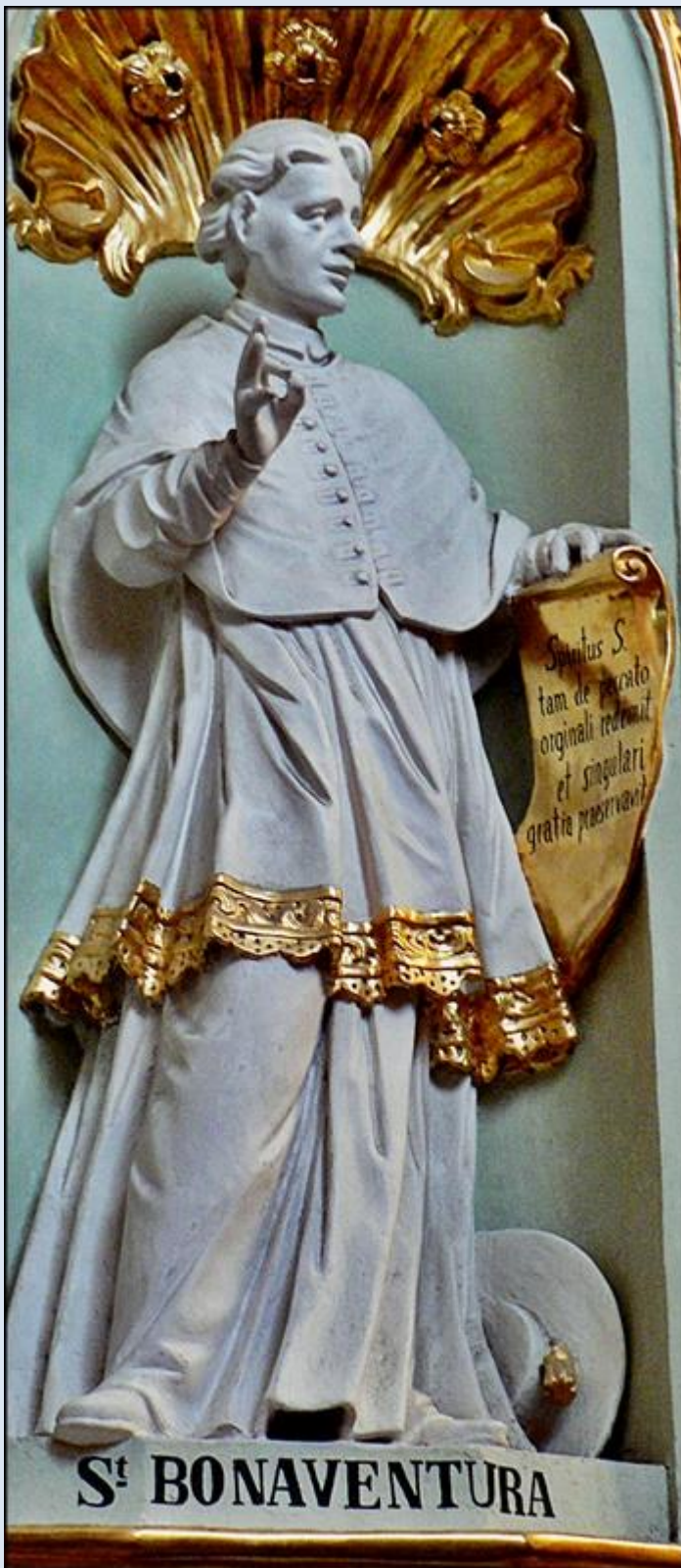
Miechów, MAŁ, figura w Bazylice Grobu Pańskiego

zobacz: Święci w Polsce i ich kult w świetle historii http://sancti-in-polonia.wietrzykowski.net/2b.html http://sancti-in-polonia.wietrzykowski.net/7b.html