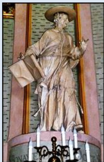
6. Włochy – Padwa, fg na kaplicy „Szkółki św. Antoniego”; P1880884- 14.VII.'12.