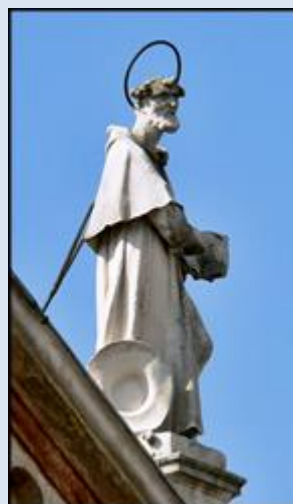
4. Miechów, MAŁ, fg w baz. Grobu Pańskiego;