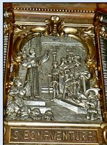
1. USA – NY, fg w katedrze św. Patryka; P1260458- 26.IX.'08.