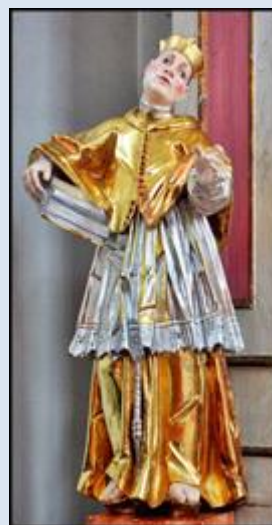
7. Włodawa, LBL, fg w ko św. Ludwika;