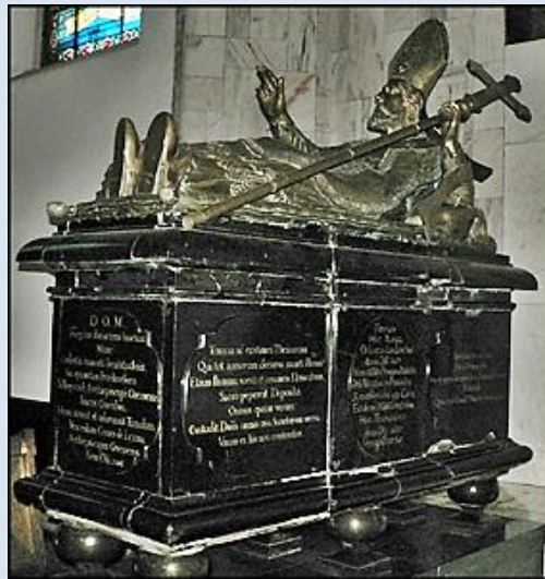
1. Uniejów, ŁDZ, wt w ko paraf;