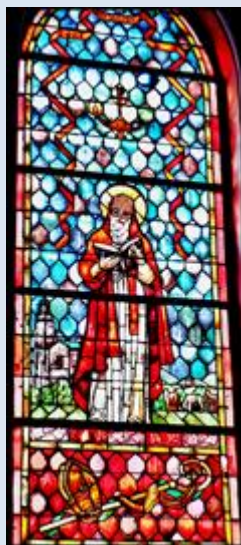
4. Frombork, ob. w baz. WNMP