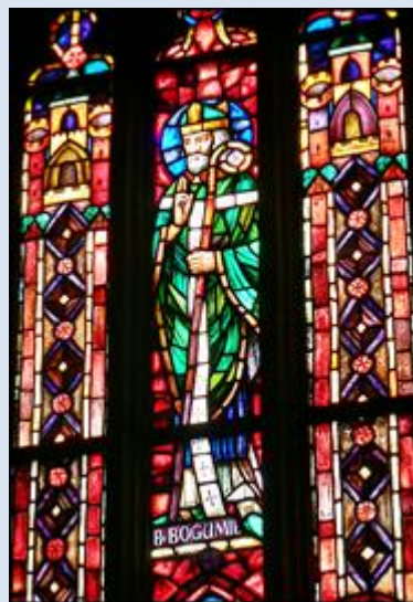
B24,5- Strzałków, ŁDZ, ob. w ko paraf. [brak]