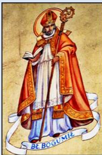
B24,8- Warszawa, fk w ko św. Stanisława bpa na Woli; B24,9- Zabartowo, fk w ko św. Jakuba