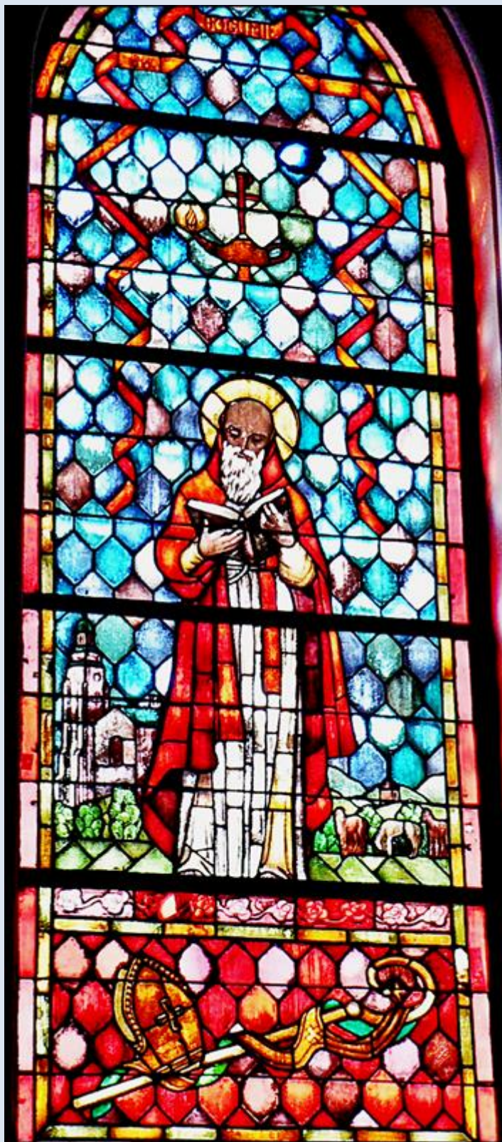
Łódź, witraż w Kościele pw. Przemienienia Pańskiego