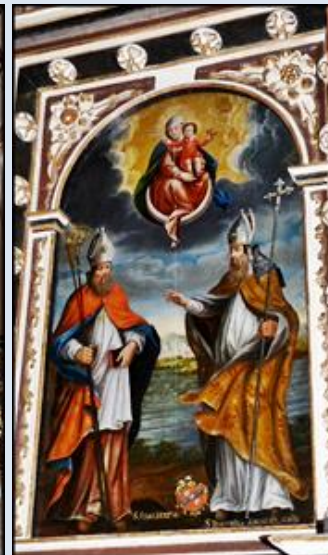
3. Gniezno, fg na baz. WNMP;