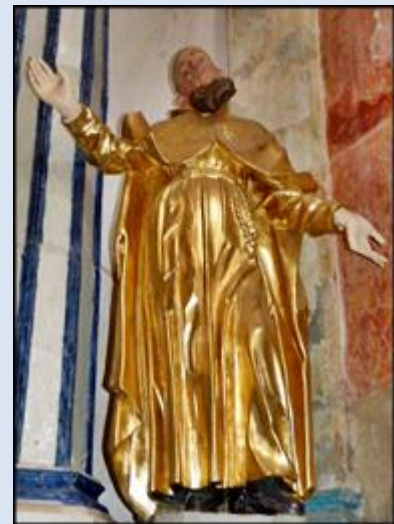
20. Wigry, ob. w ko Niepokalanego Poczęcia NMP; 21. Wigry, fg w ołtarzu Niepokalanego Poczęcia NMP;