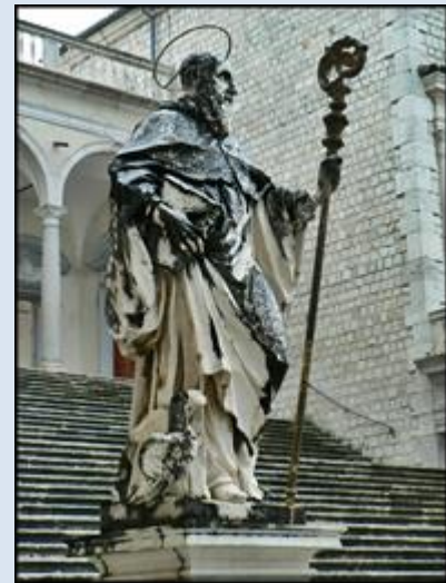
11. Włochy – Monte Cassino, fg przydrodze do klasztoru; P2060680- 9.IX.'13.