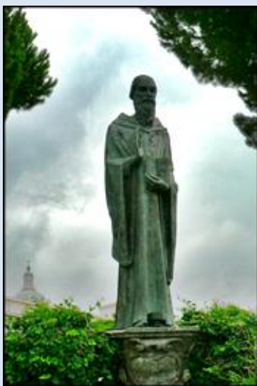
13. Włochy – Monte Cassino, fg2 na dziedzińcu klasztoru; P2060747 „