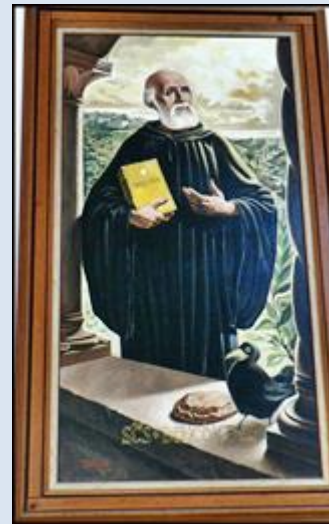
9. Madera – Canico, wiz. na budynku k. ko paraf.; P1390134- 26.IX.'09.