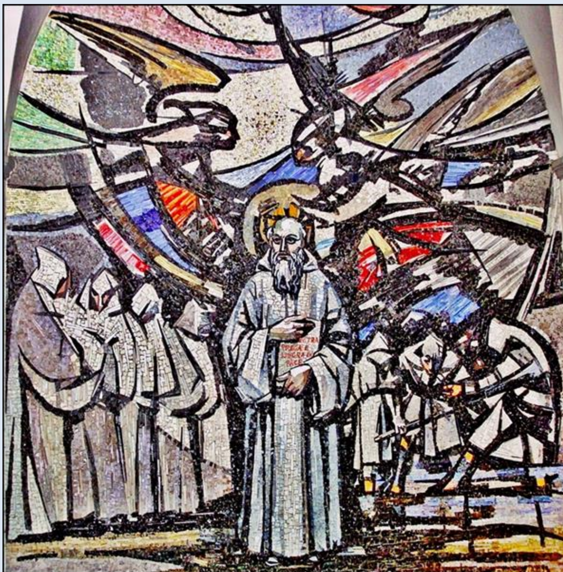
Włochy, Monte Olivetto Maggiore, Opactwo Benedyktynów