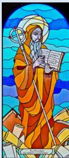
Włochy, Subiaco, klasztor św. Scholastyki (zdj. tsw) Tychy-Urbnowice, ko. MB Pośredniczki Wszelkich Łask (zdj. pw)

Jeżeli nie zaznaczono inaczej, to zdjęcia: Jan Nitecki