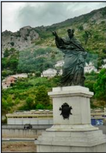
10. Włochy – Asyż, ob. w ko św. Piotra; P2070685- 13.IX.'13.