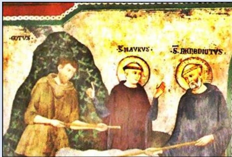
Włochy, Monte Olivetto Maggiore, Opactwo Benedyktynów (zdz. tsw) Włochy, Subiaco, Klasztor św. Benedykta (zdz. tsw)