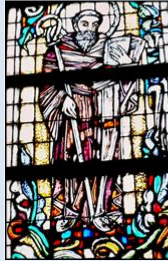
B13,26- Czarna Góra – Zagóra, MAŁ, fg w ko Przemien. Pańskiego; B13,27- Gdańsk – Oliwa, fg w baz. Św. trójcy; B13,28- Solec Kujawski, KPM, wt w ko św. Stanisława BM