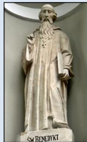
14. Włochy – Monte Cassino, fg3 k. klasztoru; P2060734,5 -