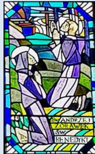
Włochy, Subiaco, Klasztor św. Scholastyki (zdz. tsw) B13,29- Sulejów, ko NMP i św. Tomasza Świętochłowice-Lipiny, ko. św. Augustyna (zdz.pw)