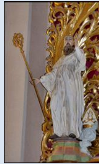
17. Suwałki, PDL, fg k. ko św. Aleksandra; 18. Wigry, PDL, fg k. ko Niepokalanego Poczęcia NMP; 19. Wigry, fg w ko Niepokalanego Poczęcia NMP;