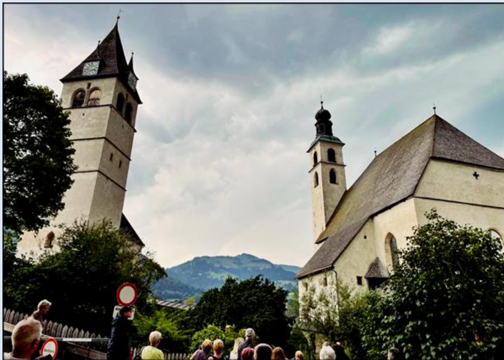
z lewej: Kościół pw. Najświętszej Maryi Panny; z prawej: Kościół św. Andrzeja