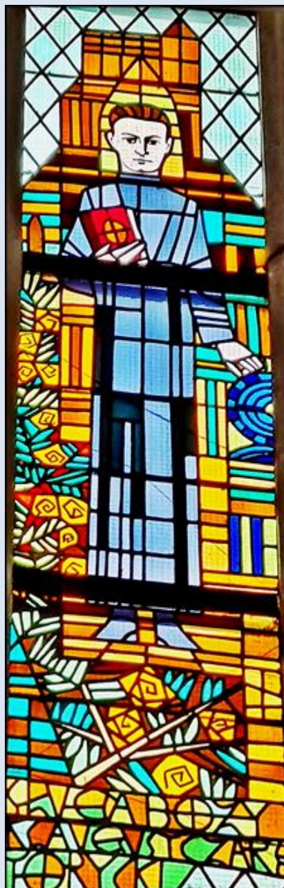
Oświęcim, Sankt. MB Wspomożenia Wiernych (zdj. pw)

Jeżeli nie zaznaczono inaczej, to zdjęcia: Jan Nitecki