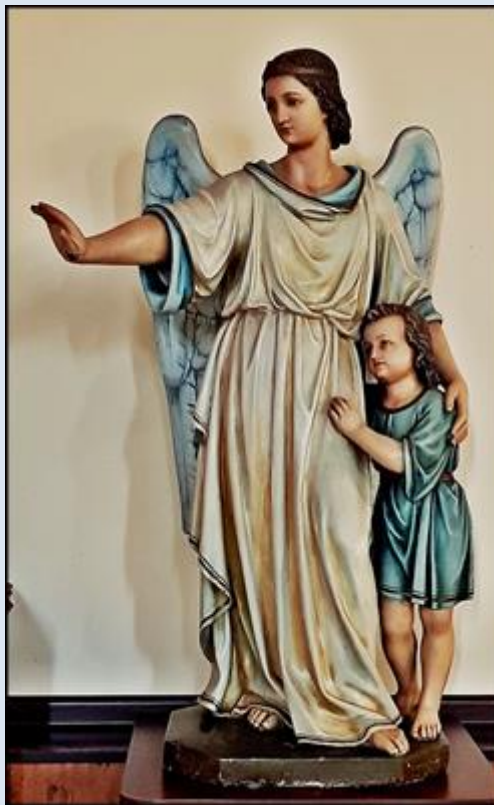
Piekary-Brzeziny, przy ko. NSPJ Zabrze, ko. św. Macieja