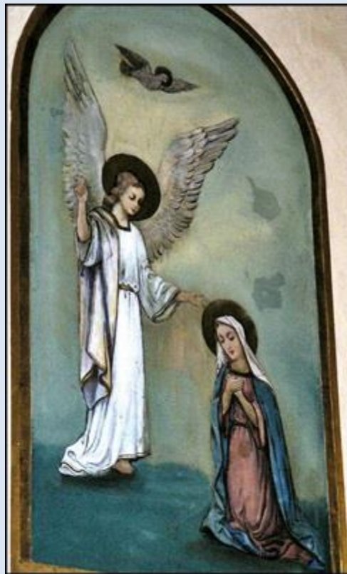
20. Wielgomłyny, ŁDZ, fk w ko św. Stanisława BM; 21. Widzów, ŚLS, ob. w ko Nawiedzenia NMP;