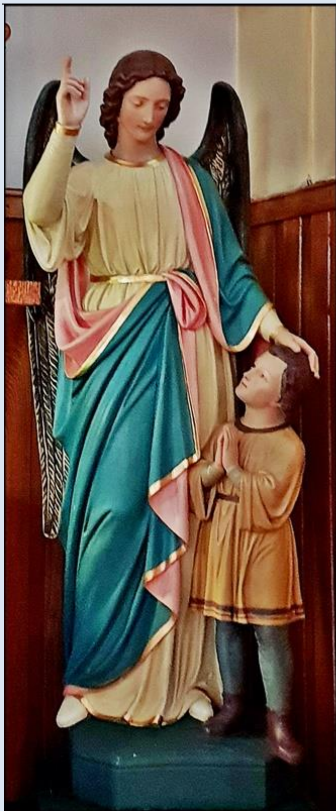
Bytom, Kościół pw. NSPJ (zdz. tsw)

zob. Święci w Polsce i ich kult w świetle historii http://sancti-in-polonia.wietrzykowski.net/2a.html http://sancti-in-polonia.wietrzykowski.net/7a.html