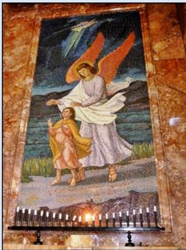
10. Miechów, MAŁ, fg w baz. – Sankt. Grobu Pańskiego, 11. Włochy - San Giovanni Rotondo, fg w baz. MB Łaskawej, P1010742- 8.IX..'13.