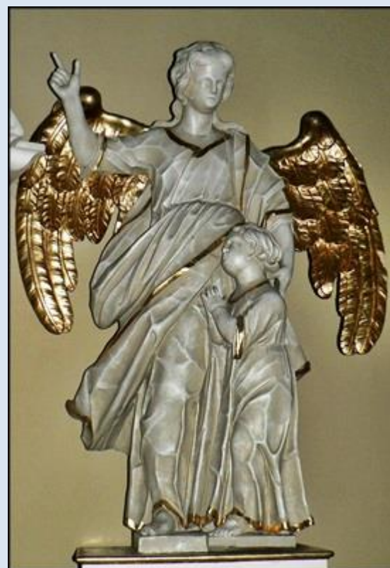
6. Warszawa, baz. Św. Krzyża, 7. Kępno, WLK, fg w ko św. Marcina,