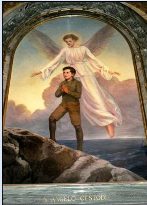
8. Zagość, ŚWK, fg z 1807 r. k. ko paraf., 9. Włochy – Turyn, ob. w ko MB Wspomożycielki, P1840261- 1.VII.'12.