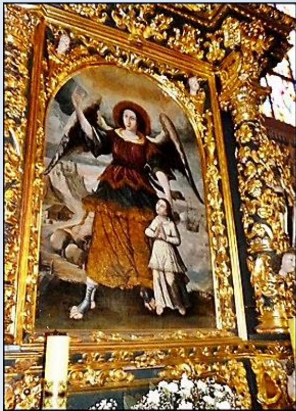
12. Szczucin, MAŁ, fg k. ko paraf., 13. Poznań, ob. w ko św. Wojciecha,