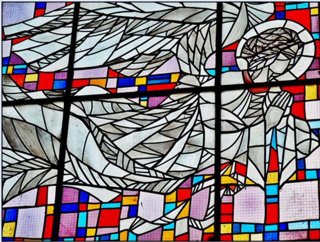
A6,28- Toruń, wt w ko Chrystusa Króla;