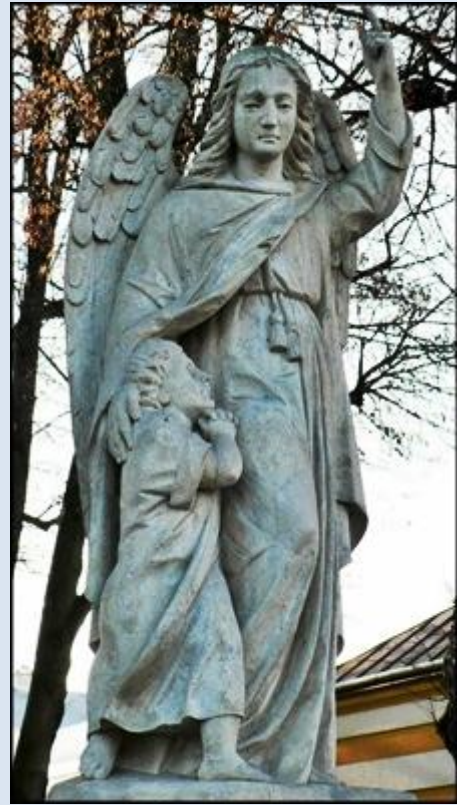
1. Szczepanów, MAŁ, baz. śś. M. Magdaleny i Stanisława BM, 2. Szczurowa, MAŁ, fg k. ko paraf.,