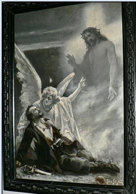
A6,24- Łódź, fg na cm. Starym; A6,25- Warszawa, ob. w kt Polowej WP