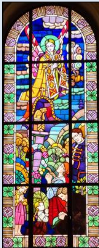
Zabrze-Zandka, ko. Ducha Świętego (zdz. pw) Bieruń Stary, Ko. św. Bartłomieja (zdz. pw)

Jeżeli nie zaznaczono inaczej, to zdjęcia: Jan Nitecki