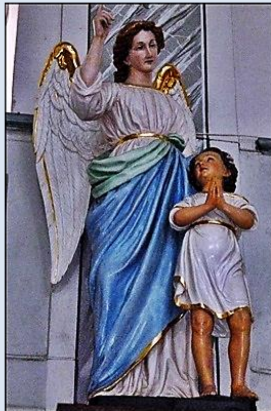
16. Złoty Stok, DLN, fg w ko Niepokal. Poczęcia NMP; 17. Stronie Śląskie, fg w ko MB Królowej Polski;