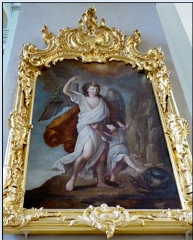
14. Sejny, PDL, fg w baz. Nawiedzenia NMP; 15. Różanystok, PDL, ob. w baz. Ofiarowania NMP;