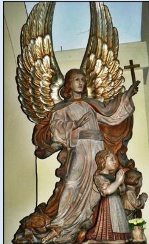
3. Rajbrot, MAŁ, fg z 1811 r. k. drew. ko paraf., 4. Radków, DLN, fg w ko św. Doroty,