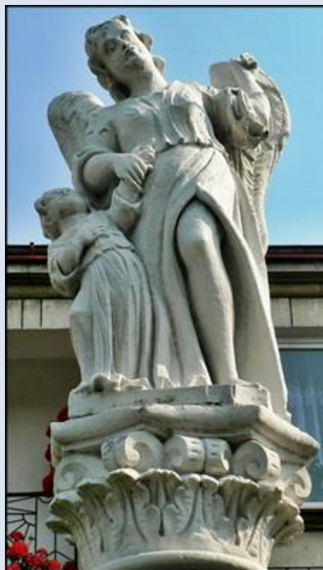
5. Pińczów, ŚWK, fg przydomowa,