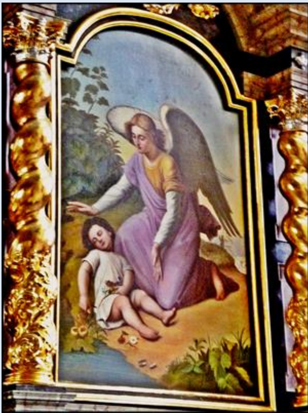
A6,29- Toruń, ob. w ko św. Katarzyny;

Kiedy się modlisz kochane dziecę, To biały Anioł cieszy się z ciebie! I dobrze tobie będzie na świecie, Bo błogosławi cię Pan Bóg w niebie!