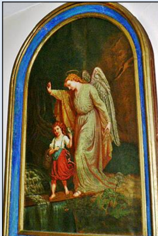
22. Bogdanów, ŁDZ, ob. w ko Przenajśw. Trójcy; A6,23- Lubliniec, ŚLS, ob. w ko św. Mikołaja BW;