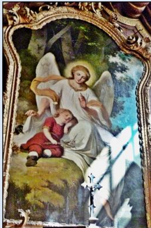
A6,26- Warszawa, ko. WNMP A6,27- Wrocław, ob. w ko Najśw. Imienia Jezus;