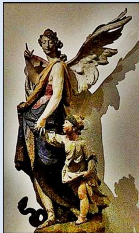
Strzelce Opolskie, Ko. św. Wawrzyńca Niemcy, Monachium, Bürgersaalkirche