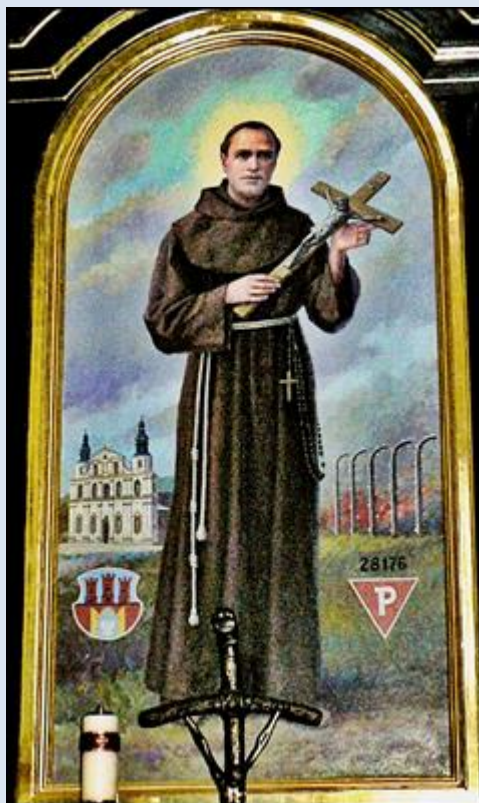
A37,5- Kraków, ob. w ko św. Bernardyna ze Sieny.