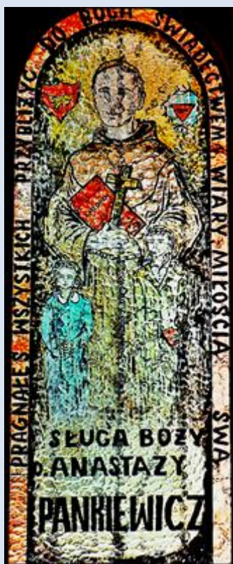
A37,3- „ fg k. ko „ A37,4- Zakopane, wt w ko św. Antoniego;