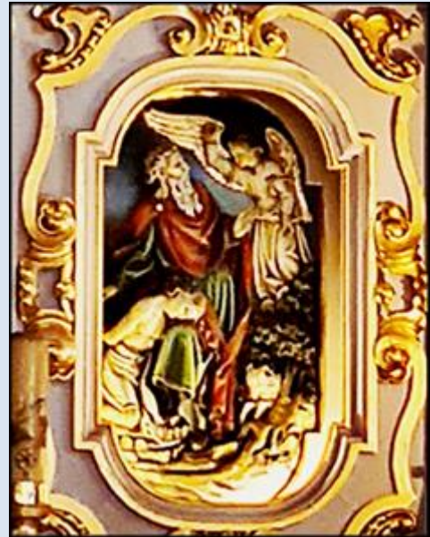
Prudnik, ko. św. Michała Arch. (zdj. pw) Zabrze-Rokitnica, ko. NSPJ (zdj. pw) Tychy, ko. św. Marii Magdaleny (zdj. pw)