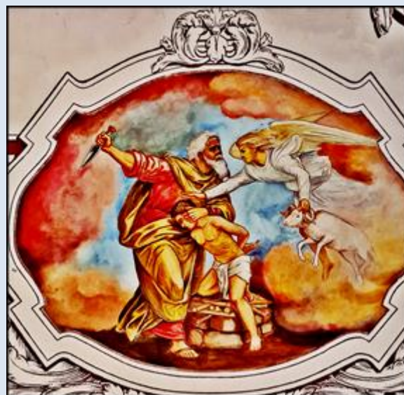
Mikołów-Bujaków, Sanktuarium MB - Opiekunki Środowiska Naturalnego