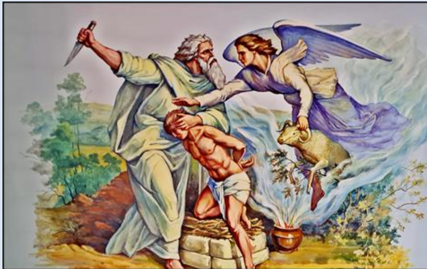
Wolbrom, ko. Podwyższenia Krzyża Świętego