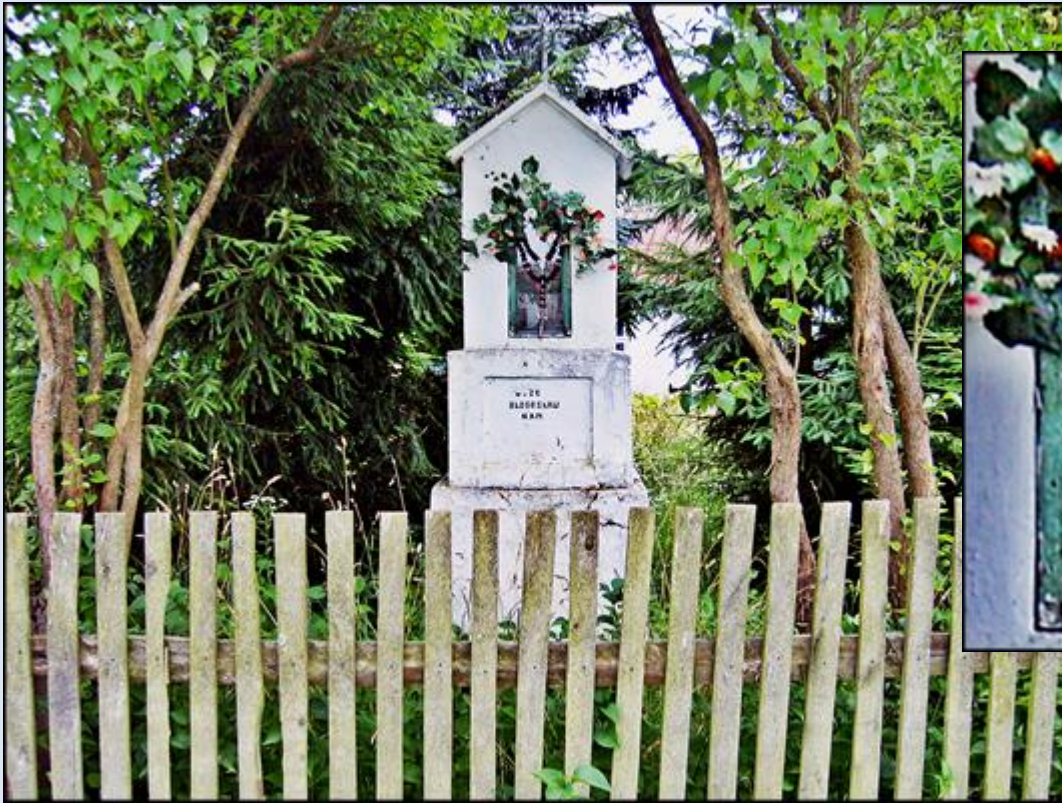
Szygi k/Różana (zdj. Grażyna Sygowska)