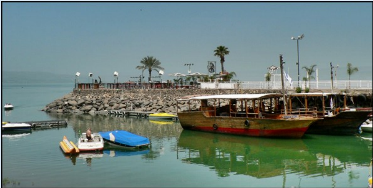
Jordan – miejsce chrztu Chrystusa