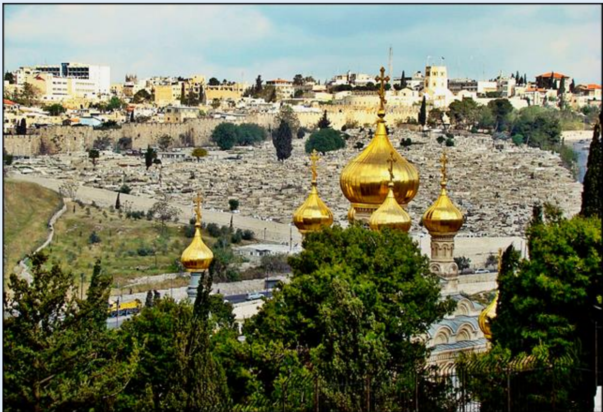
zdjęcia: Kamila Nitecka

zdjęcia w czerwonym obramowaniu zapożyczono z: https://upload.wikimedia.org/wikipedia/commons/d/d7/Eglise_russe_sur_le_mont_des_Oliviers_Russian_church_on_the_mount_of_Olives_-_Bonfils_LCCN2004667854.jpg https://upload.wikimedia.org/wikipedia/commons/0/08/Church_of_Mary_Magdalene_IMG_3522.JPG